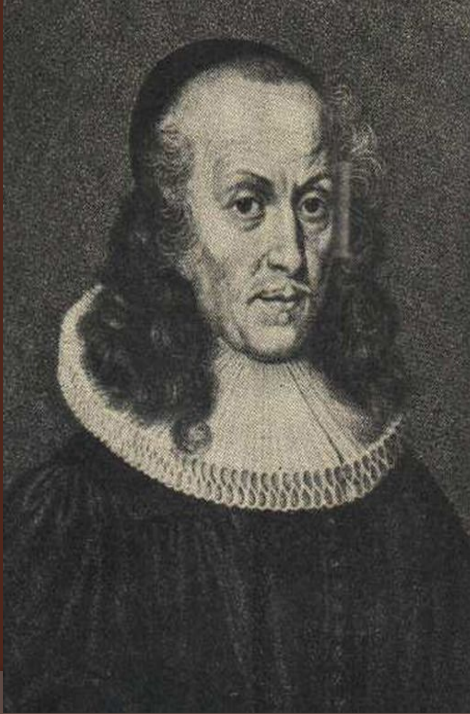
Вольфганг Ратке (Ратихия) (1571—1635)