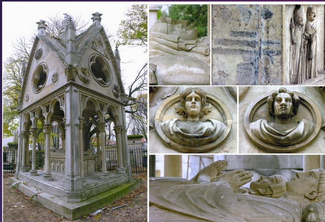
Могила Абеляра и Элоизы на кладбище Пер-Лашез

АБЕЛЯР УДАЛИЛСЯ В КЛЮНИ, ГДЕ УМЕР В МОНАСТЫРЕ СЕН-МАРСЕЛЬ-СЮР-СОН В 1142 ГОДУ В ЖАК-МАРИНЕ.