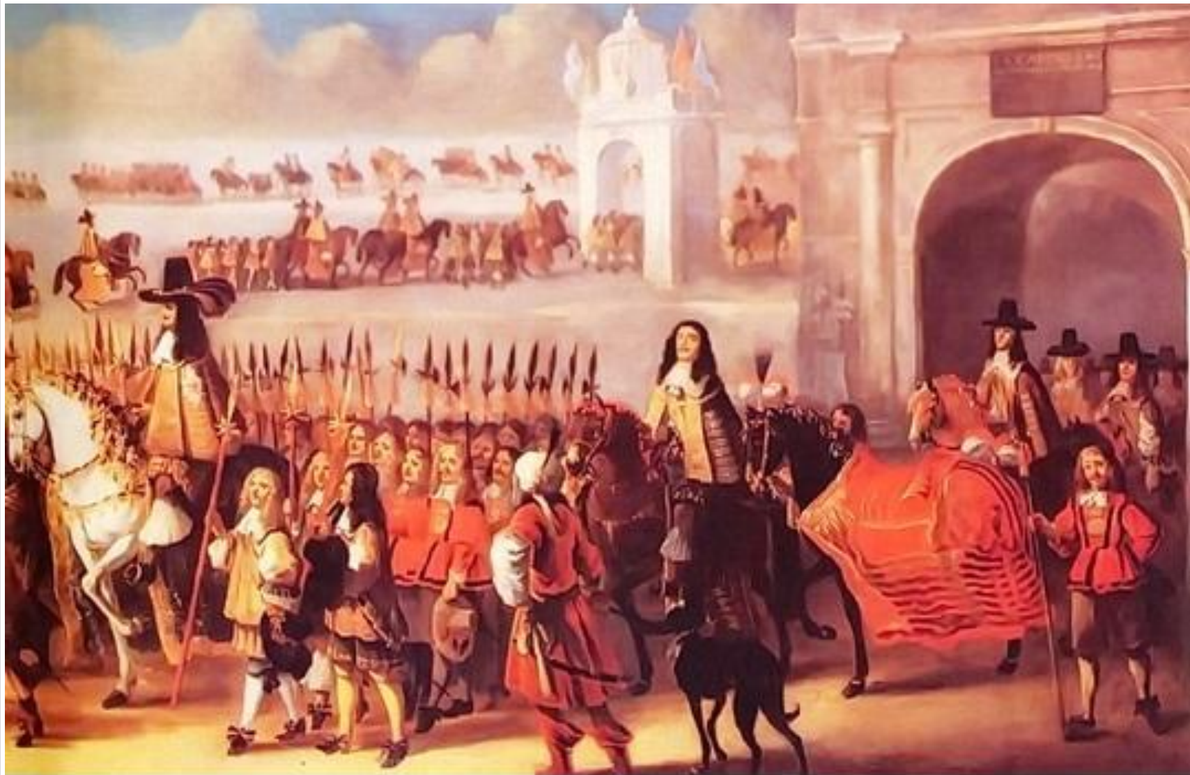
Стюарты. Въезд Карла II в Уайтхолл в 1660 году.