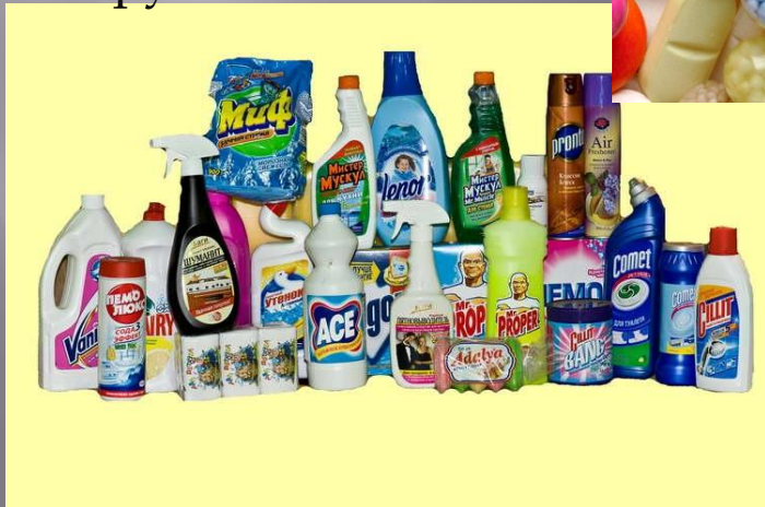
Хімічні речовини побуту