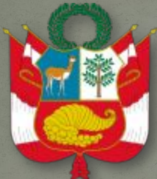
Герб Республики Перу