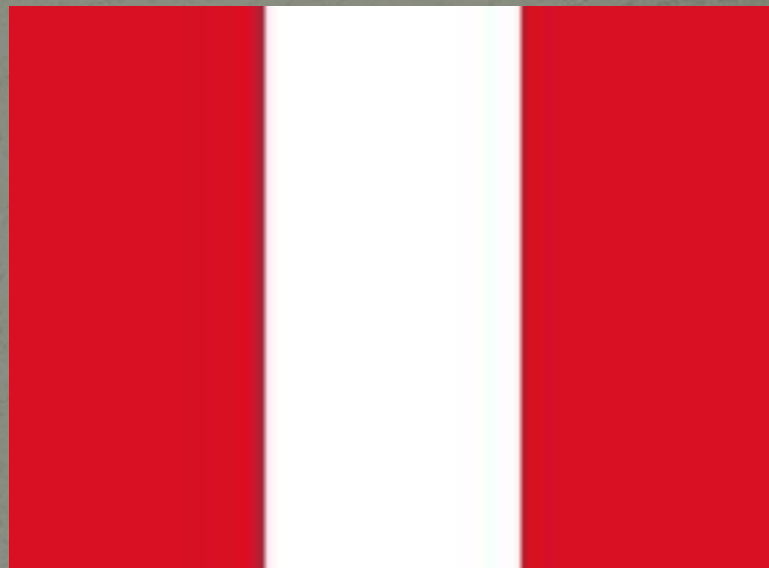
Флаг республики Перу