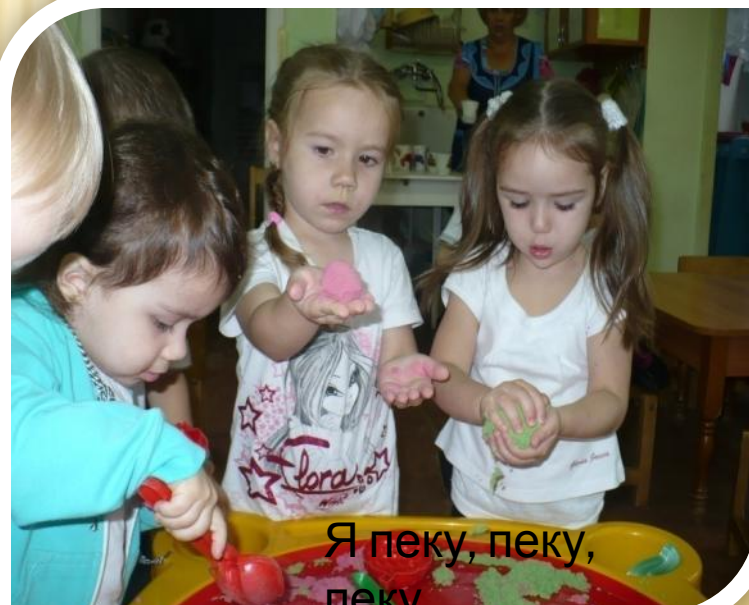
Я пеку, пеку, пеку.