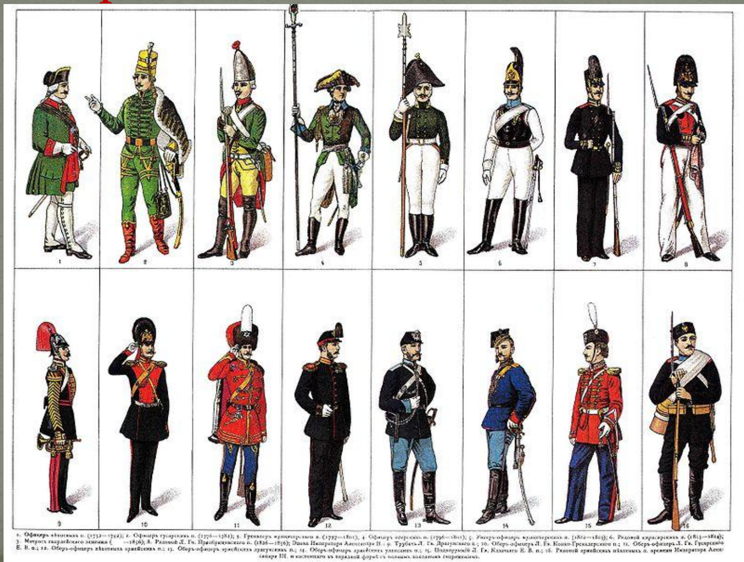
1. Офицер восточных в. (1713—1744); 2. Офицер турецкого в. (1736—1794); 3. Генерал армянского в. (1792—1801); 4. Офицер швейцарского в. (1796—1801); 5. Штаб-офицер кавалерийского в. (1802—1812); 6. Рядовой кавалерийского в. (1813—1814); 7. Младший сарматского полка (—1806); 8. Рядовой С. Гв. Преображенского п. (1816—1818); 9. Штаб-офицер армянского в. (1818—1820); 10. Штаб-офицер армянского в. (1821—1823); 11. Штаб-офицер армянского в. (1824—1826); 12. Штаб-офицер армянского в. (1827—1829); 13. Штаб-офицер армянского в. (1830—1832); 14. Штаб-офицер армянского в. (1833—1835); 15. Штаб-офицер армянского в. (1836—1838); 16. Штаб-офицер армянского в. (1839—1841).