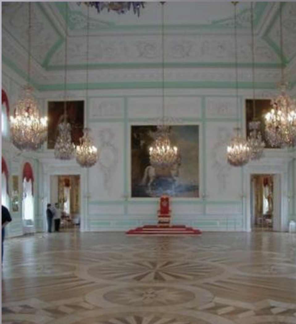
Тронный зал (самый большой (330 кв. м.) и наиболее торжественный зал дворца )