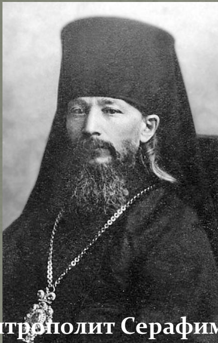
Митрополит Серафим (в миру Дмитрий Александрович Александров (19 (31). 10. 1867-212. 1937) Епископ Русской православной церкви, митрополит Казанской и Свияжский