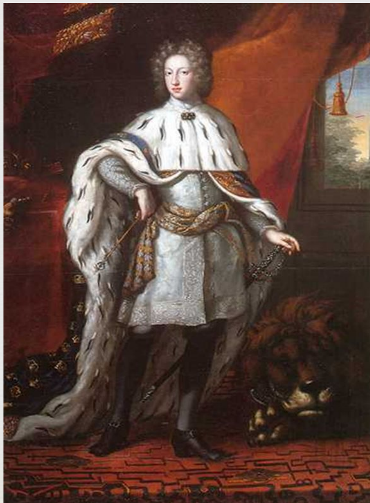
Карл XII в королевской мантии. День коронации.

Король Швеции (1697-1718) Карл XII родился 17 июня 1682 года. Сын шведского короля Карла XI и королевы Ульрики Элеоноры, принцессы Датской. Получил хорошее классическое образование, владел несколькими иностранными языками. После смерти Карла XI юный Карл, которому было неполных 15 лет, вопреки предсмертной воле отца настоял на признании его совершеннолетним и взял власть в свои руки. Швеции в этот период противостоял тройственный союз Дании, Польши и России.