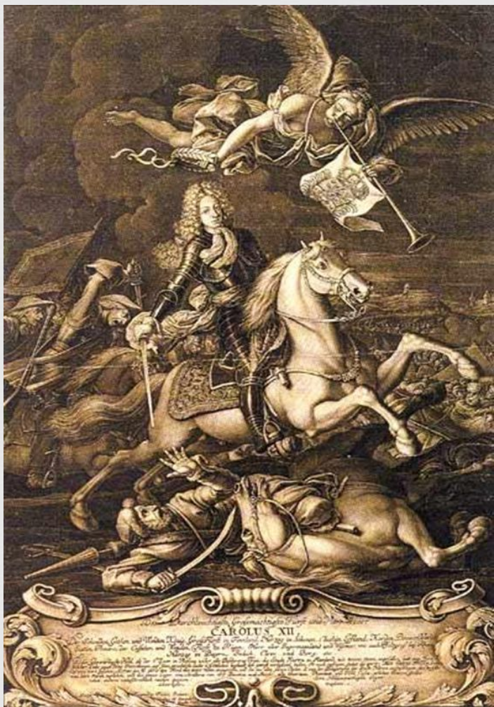
Карл XII в сражении под Нарвой. 19 ноября 1700. Гравюра Г.-Ф. Ругендаса

19 ноября 1700 года под Нарвой Карл одержал победу над превосходящими силами русских. Битва и победа под этим городом принесли Карлу XII славу великого полководца.