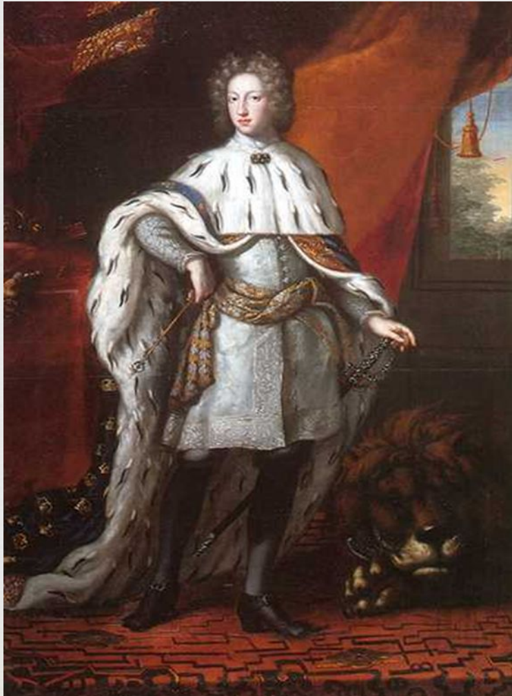
Карл XII в королевской мантии. День коронации.

Король Швеции (1697-1718) Карл XII родился 17 июня 1682 года. Сын шведского короля Карла XI и королевы Ульрики Элеоноры, принцессы Датской. Получил хорошее классическое образование, владел несколькими иностранными языками. После смерти Карла XI юный Карл, которому было неполных 15 лет, вопреки предсмертной воле отца настоял на признании его совершеннолетним и взял власть в свои руки. Швеции в этот период противостоял тройственный союз Дании, Польши и России.