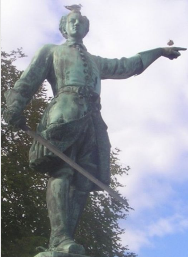
Памятник Карлу в Стокгольме, указывающему рукой на Россию.

С началом Северной войны 13 апреля 1700 года король покинул Стокгольм и с 5-тысячной армией на кораблях устремился к датским берегам. Данию он застал врасплох, и под угрозой разрушения Копенгагена датский король Фредерик IV был вынужден заключить мир. Дания вышла из войны.