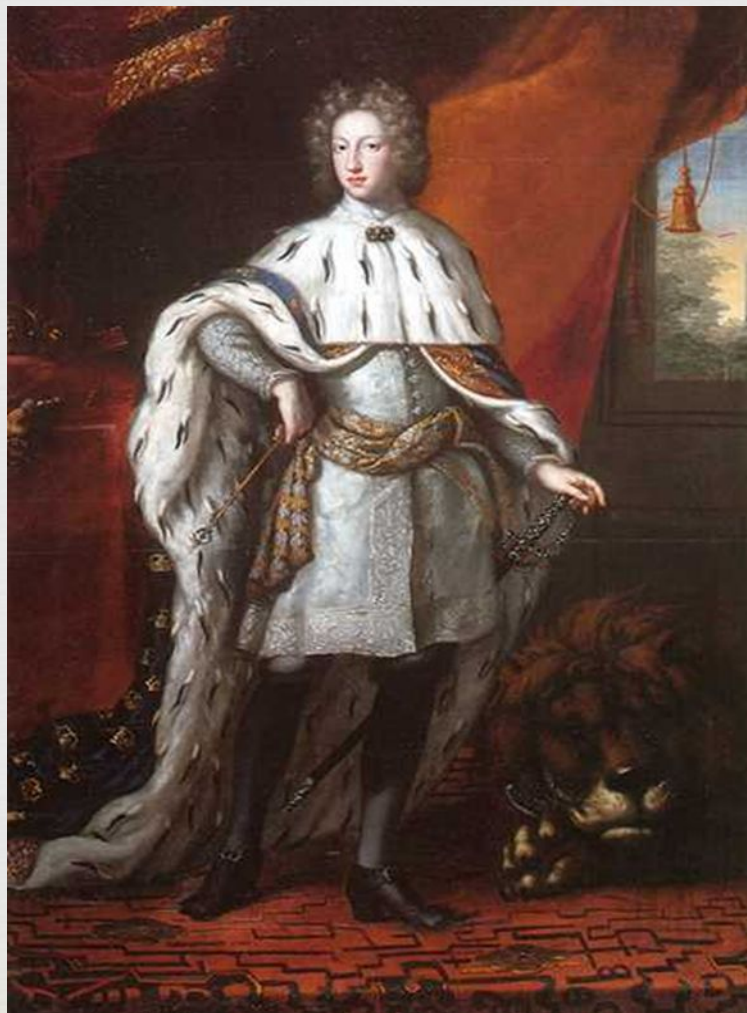
Карл XII в королевской мантии. День коронации.

Король Швеции (1697-1718) Карл XII родился 17 июня 1682 года. Сын шведского короля Карла XI и королевы Ульрики Элеоноры, принцессы Датской. Получил хорошее классическое образование, владел несколькими иностранными языками. После смерти Карла XI юный Карл, которому было неполных 15 лет, вопреки предсмертной воле отца настоял на признании его совершеннолетним и взял власть в свои руки. Швеции в этот период противостоял тройственный союз Дании, Польши и России.