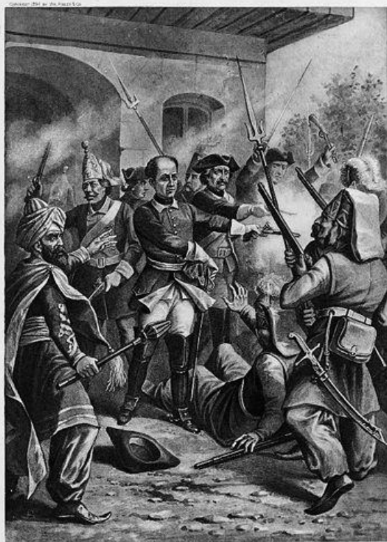
CHARLES XII AT BENDER.

После шести лет пребывания в Турции король вернулся на родину в 1715 году. Последние годы жизни Карл провел, готовясь к отражению ожидавшихся в 1716 году нападений со стороны Дании и России, а также дважды вторгаясь в Норвегию. В этот период он провел ряд внутренних реформ, направленных на мобилизацию сил для войны.