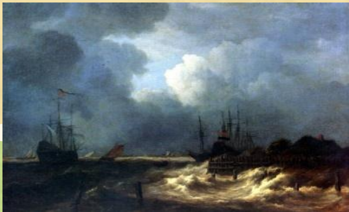
Морской пейзаж (марина)