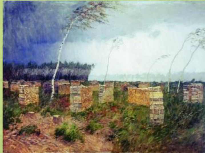
Романтический пейзаж - гроза, тучи, ветер