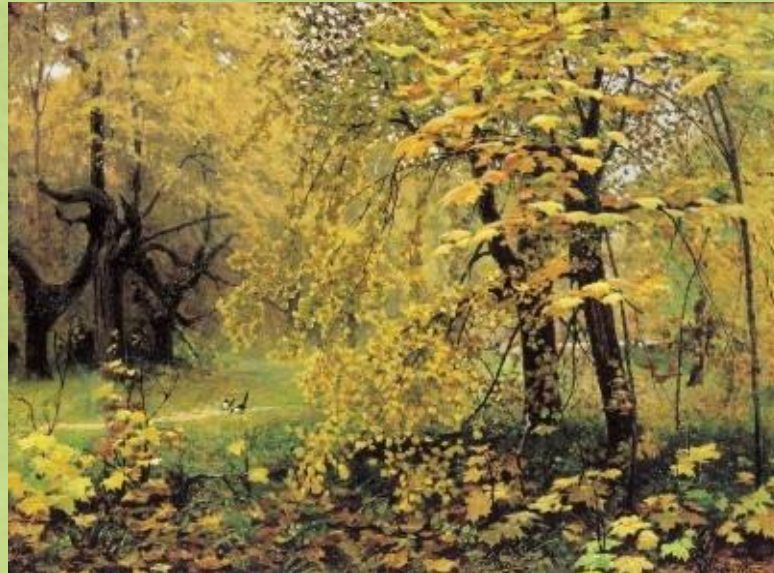
Пейзаж настроения - лирическая окраска, передача чувств ( грусть, тоска, радость)