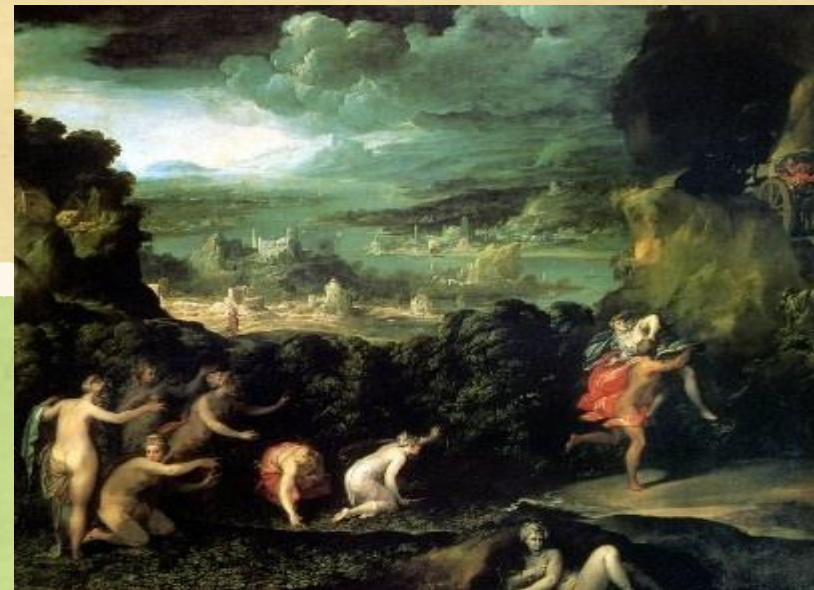
Героический пейзаж - горы, гладь воды, мифические герои и боги