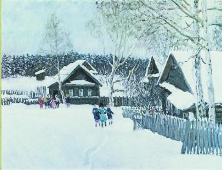
Сельский пейзаж- деревенский быт, окружающая природ