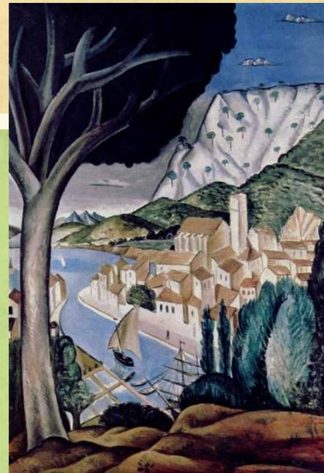
Декоративный пейзаж - для украшения интерьера, с условным уветом и композицией