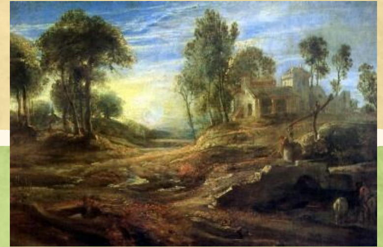
Эпический пейзаж - величественный картины природы, сильные и спокойные