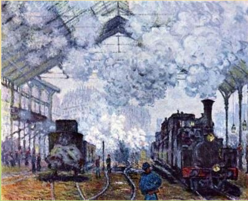
Индустриальный пейзаж - заводы, фабрики, вокзалы, мосты, железная дорога