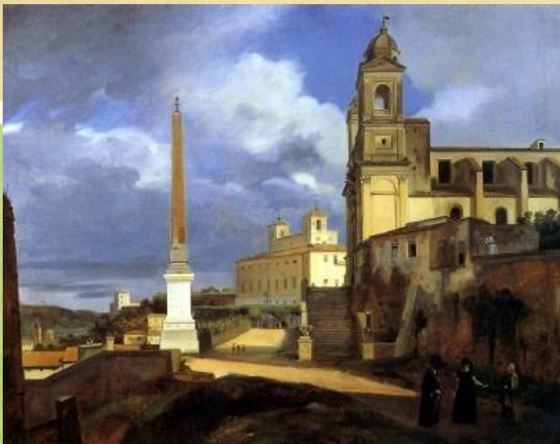
Архитектурный пейзаж ( близок к городскому)