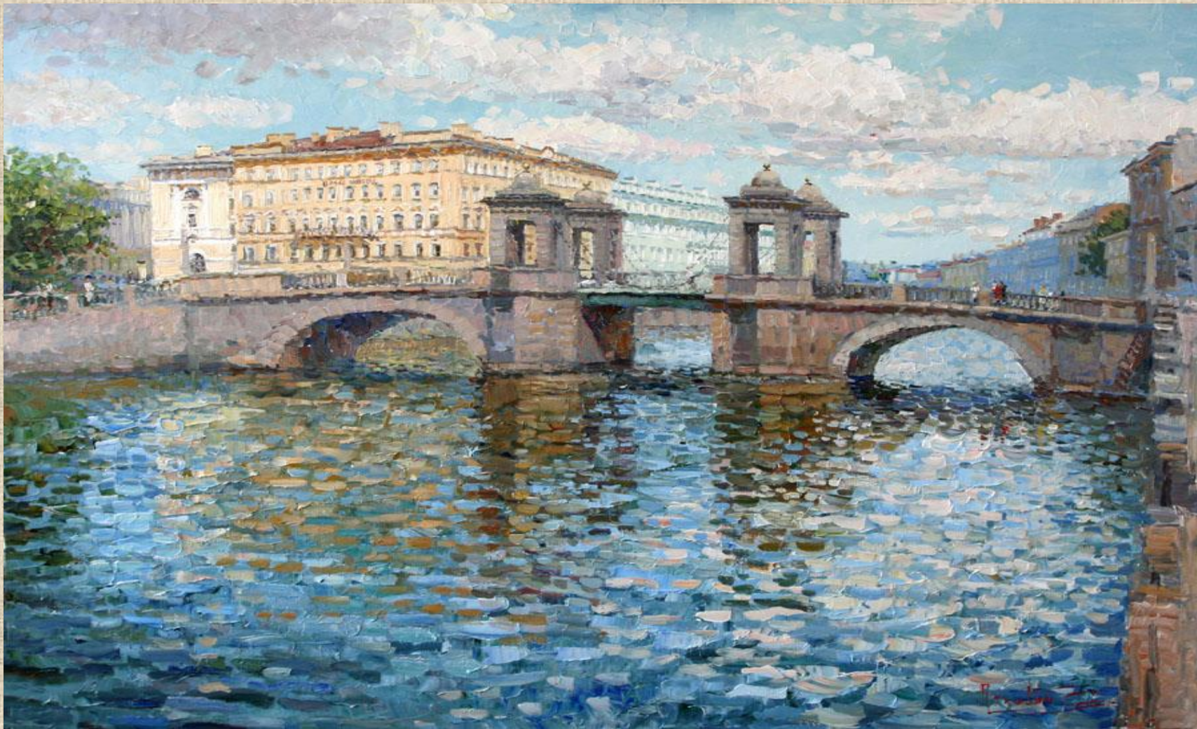
С.Ляхович «Ломоносовский мост»