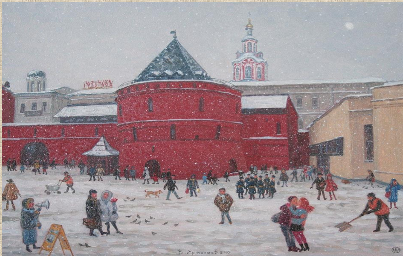
В.Ермолаев «Площадь Революции»