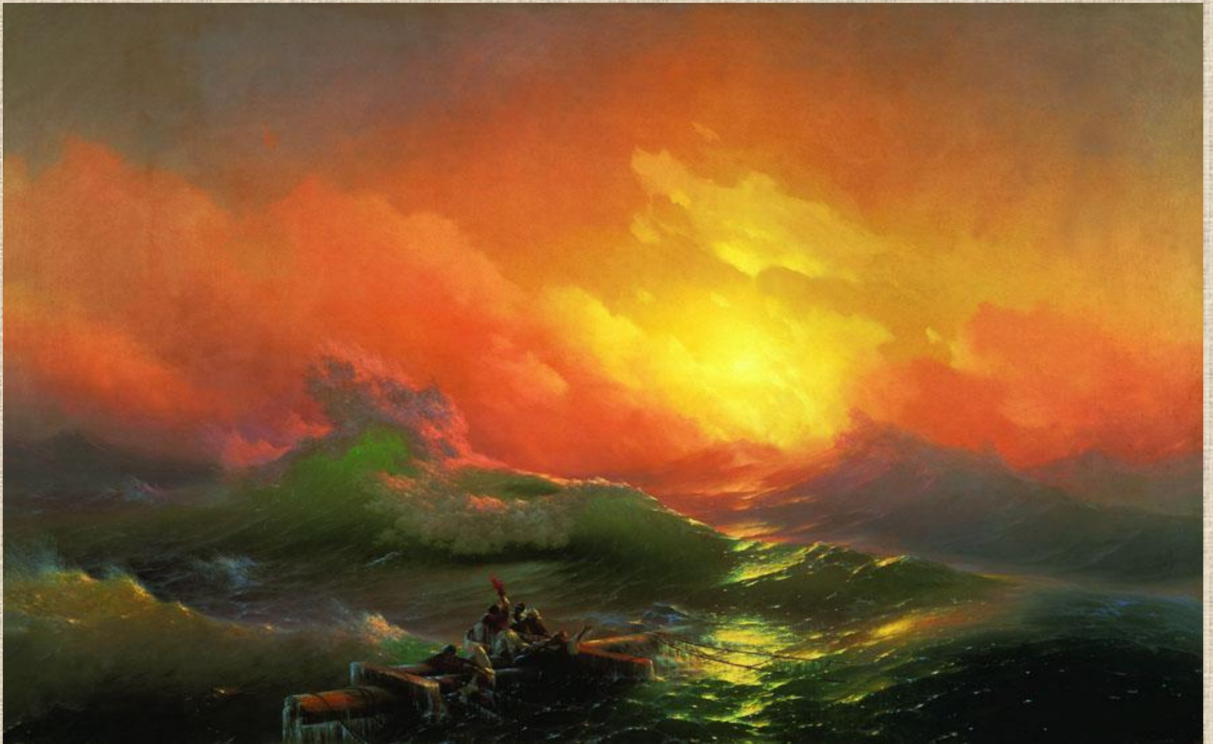
И. Айвазовский «Девятый вал»