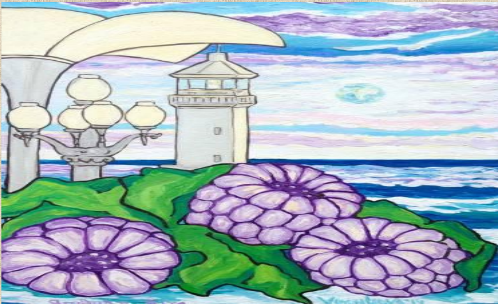
А.Воронцова «Ягодная Ялта»