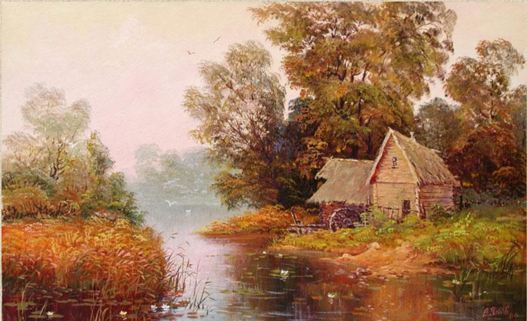
В.Янов «Домик у реки»