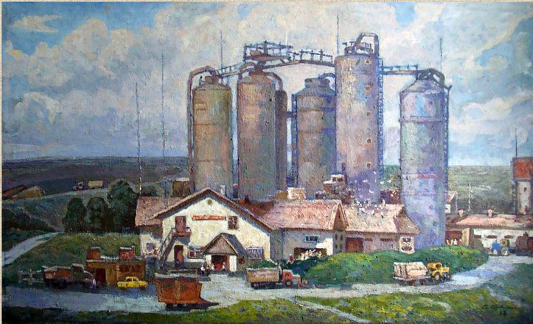
В.Швец «Индустрия села»