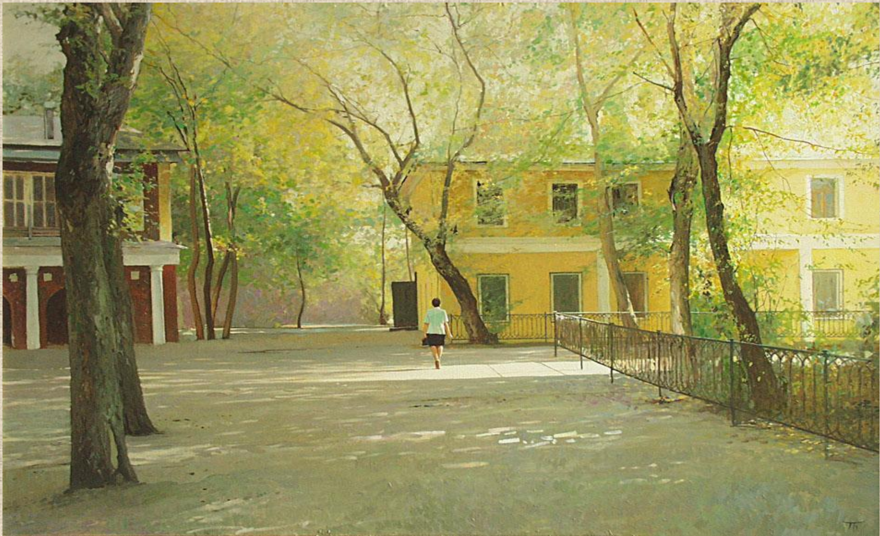
П.Безруков «Московский дворик»