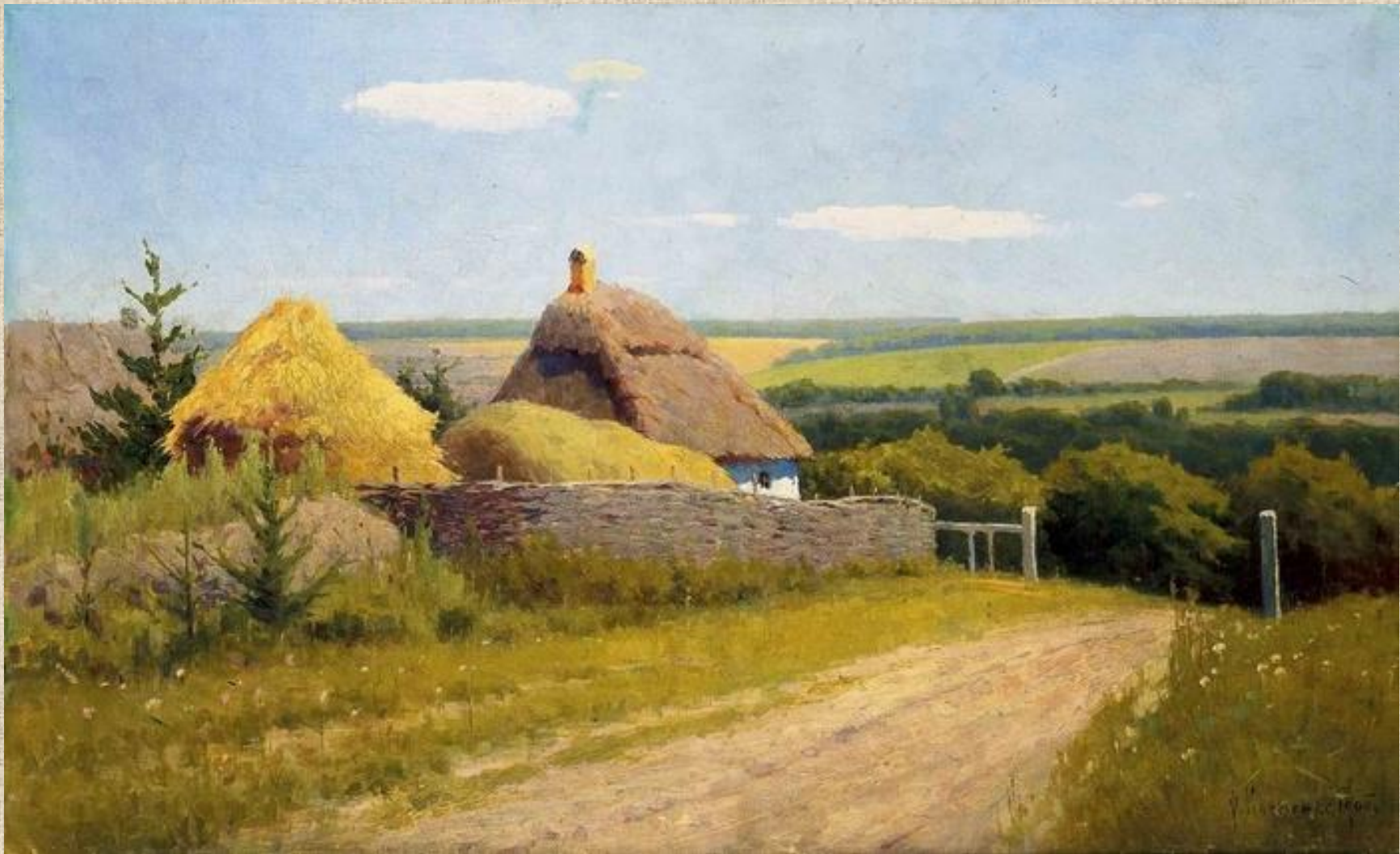
Ф.Клименко «Край села»