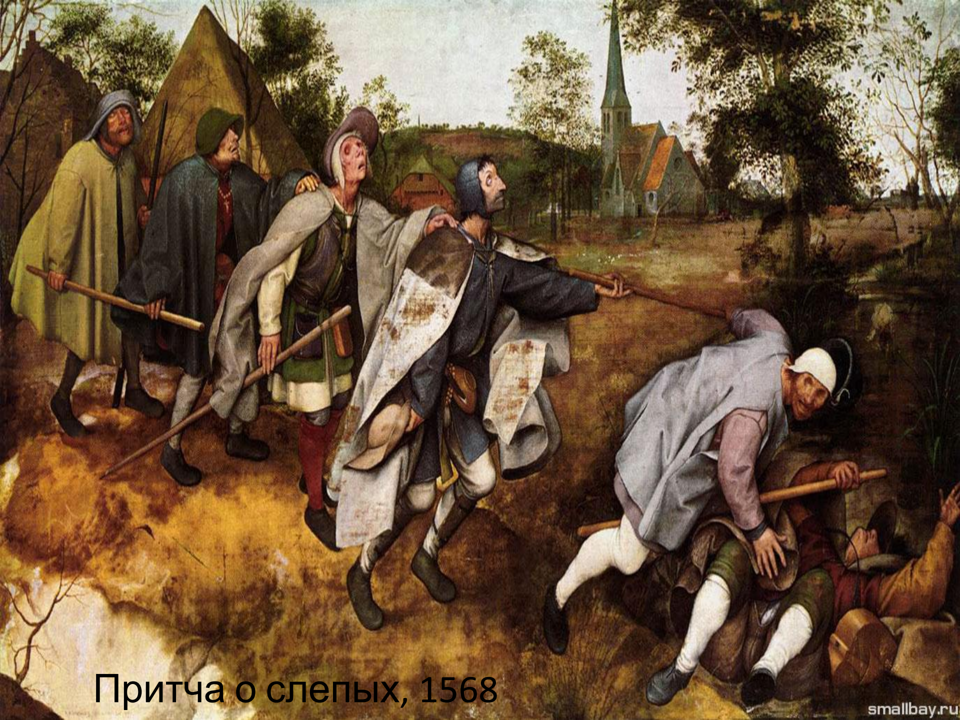
Притча о слепых, 1568