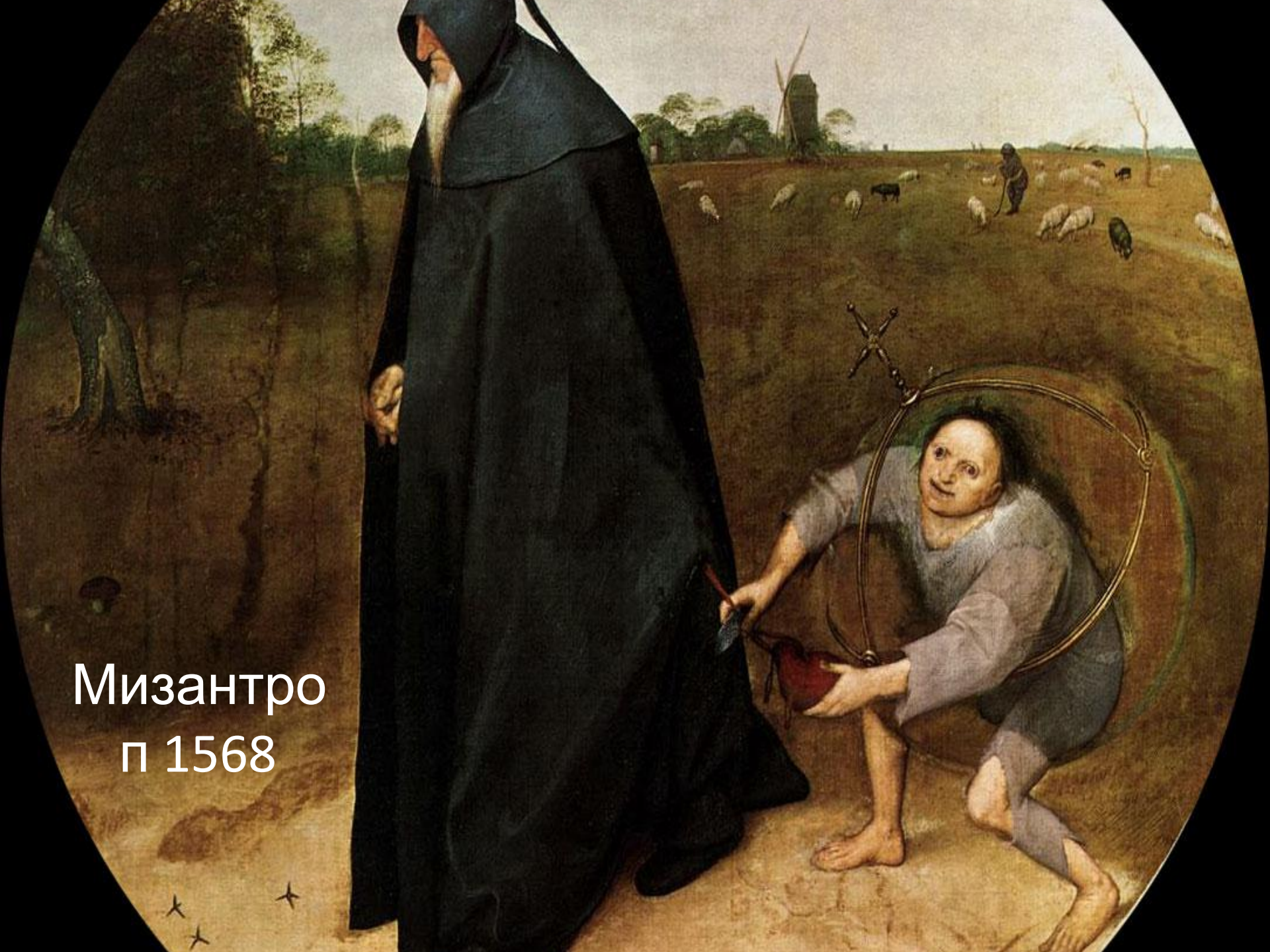
Мизантро п 1568