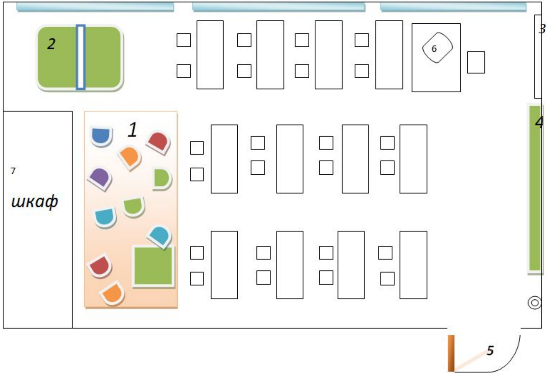
Схема предметно-развивающей среды кабинета