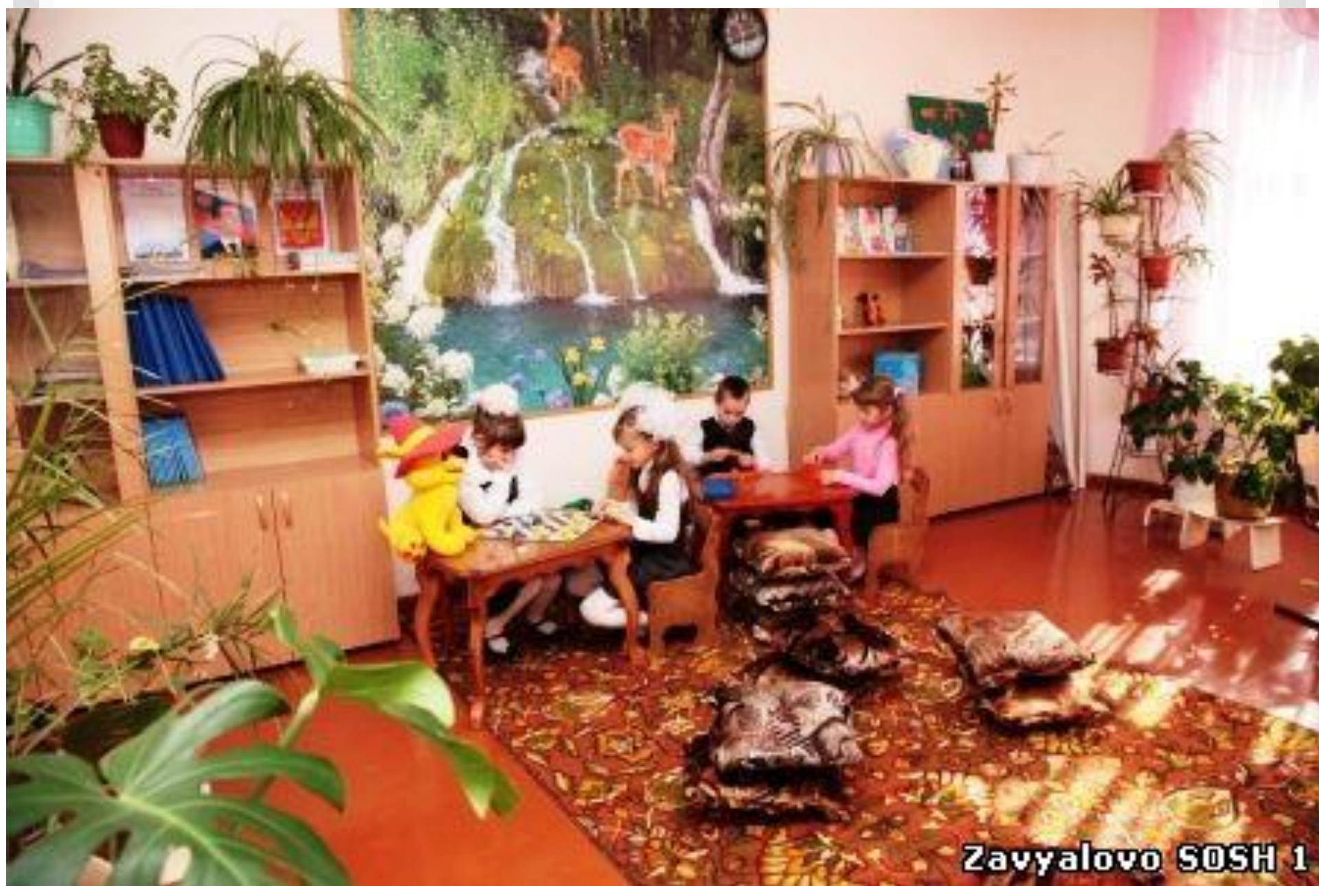
Zavyalovo SOSH 1