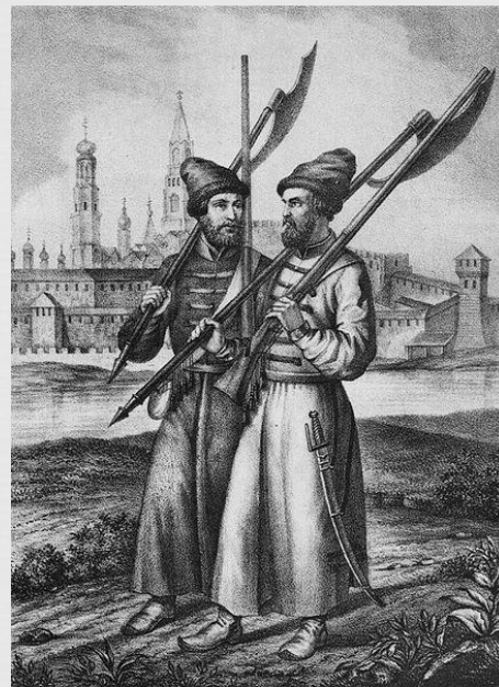
Рядовые стрельцы в 1674 году.

Если поначалу среди офицеров были преимущественно иностранные специалисты, то после начала работы навигационной, артиллерийской, инженерной школ рост армии удовлетворялся русскими офицерами из дворянского сословия. В 1715 году в Петербурге была открыта Морская академия. В 1716 году был издан Воинский Устав, строго определявший службу, права и обязанности военных. — В результате преобразований была создана сильная регулярная армия и мощный военно-морской флот, которого ранее у России просто не было. К концу царствования Петра численность регулярных сухопутных войск достигала 210 тыс. (из них числилось 2600 в гвардии, 41 560 в коннице, 75 тыс. в пехоте, 14 тыс. в гарнизонах) и до 110 тыс. нерегулярных войск. Флот состоял из 48 линейных кораблей; 787 галер и