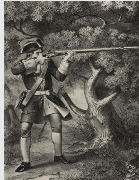
Рядовой армейского пех. полка в 1720—32 гг.