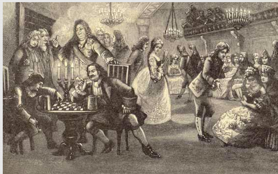
Ассамблея при Петре I.