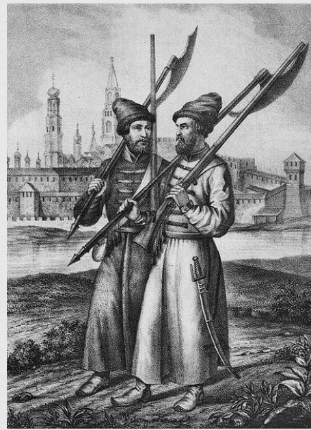
Рядовые стрельцы в 1674 году.

Если поначалу среди офицеров были преимущественно иностранные специалисты, то после начала работы навигационной, артиллерийской, инженерной школ рост армии удовлетворялся русскими офицерами из дворянского сословия. В 1715 году в Петербурге была открыта Морская академия. В 1716 году был издан Воинский Устав, строго определявший службу, права и обязанности военных. — В результате преобразований была создана сильная регулярная армия и мощный военно-морской флот, которого ранее у России просто не было. К концу царствования Петра численность регулярных сухопутных войск достигала 210 тыс. (из них числилось 2600 в гвардии, 41 560 в коннице, 75 тыс. в пехоте, 14 тыс. в гарнизонах) и до 110 тыс. нерегулярных войск. Флот состоял из 48 линейных кораблей; 787 галер и