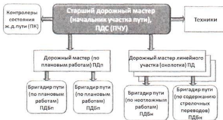
Рис.1. Организационная структура эксплуатационного участка при подчинении ПК непосредственно ПДС (ПЧУ)