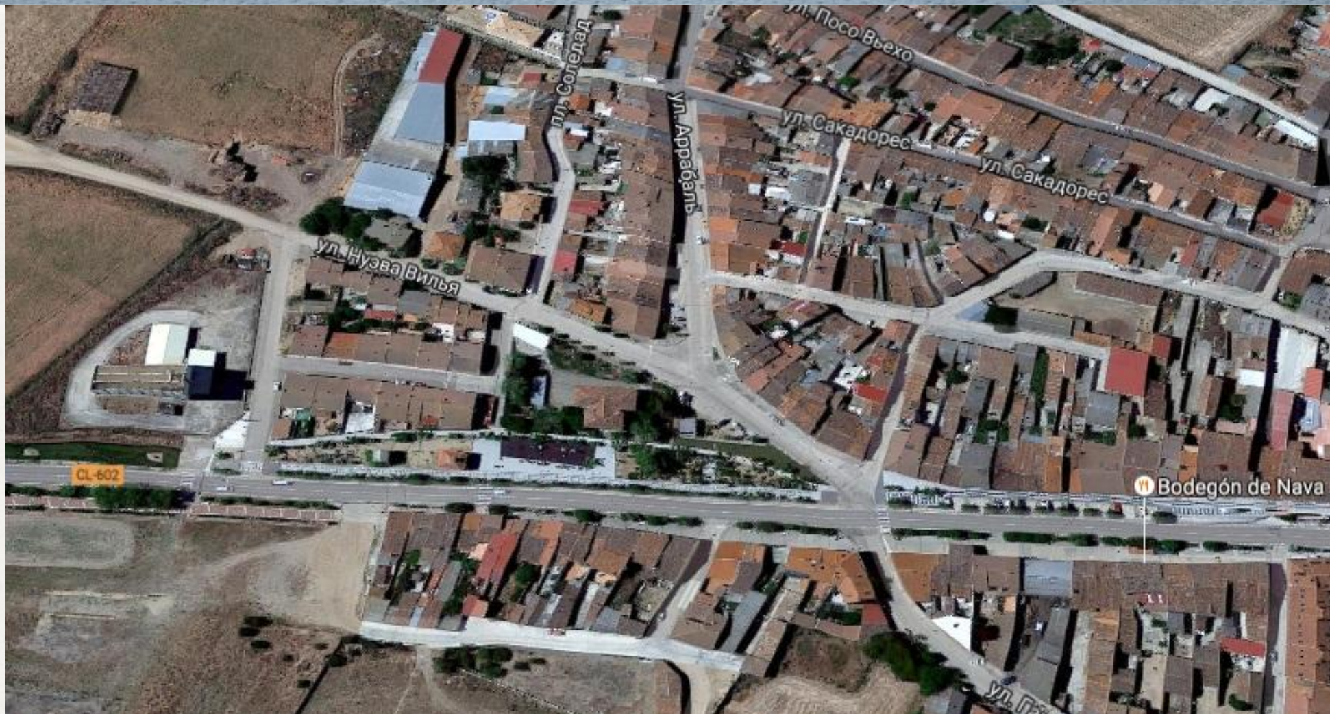
Нова-дель-Рей – Испания. Население – 2123 чел. «Плохой» посёлок.