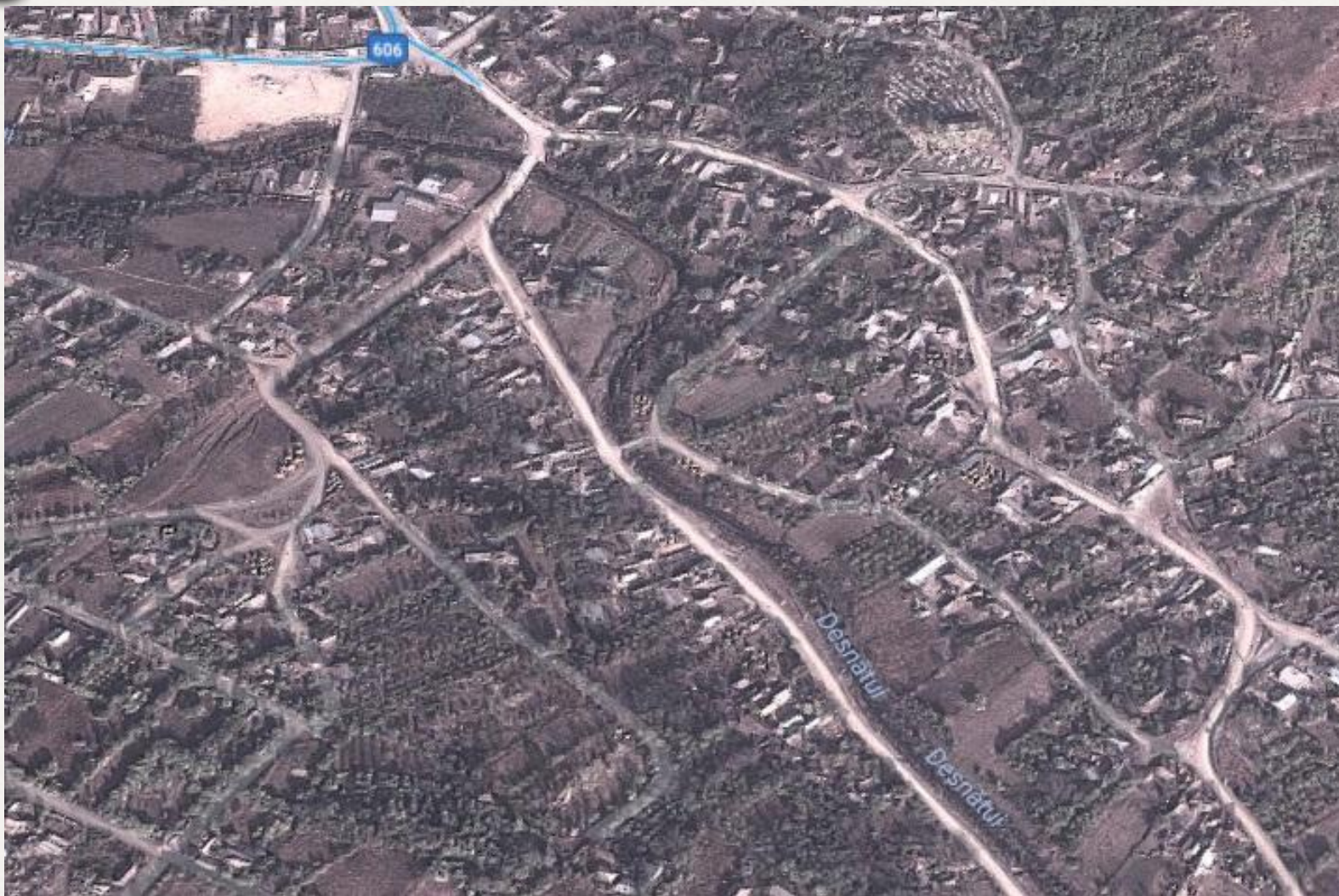
Клянов - Румыния. Население - 1648 чел. «Плохой» посёлок.