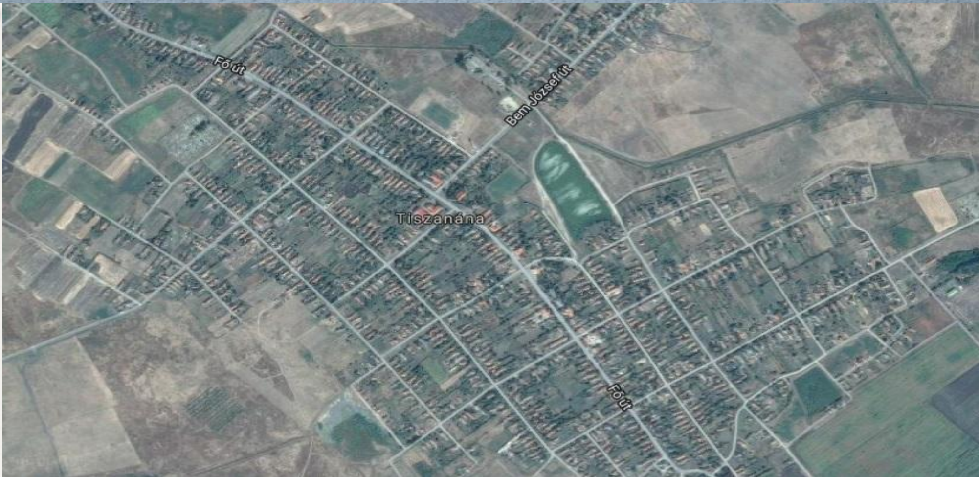
Tiszanána — Северная Венгрия. Население - 2474 человек «Хороший» посёлок