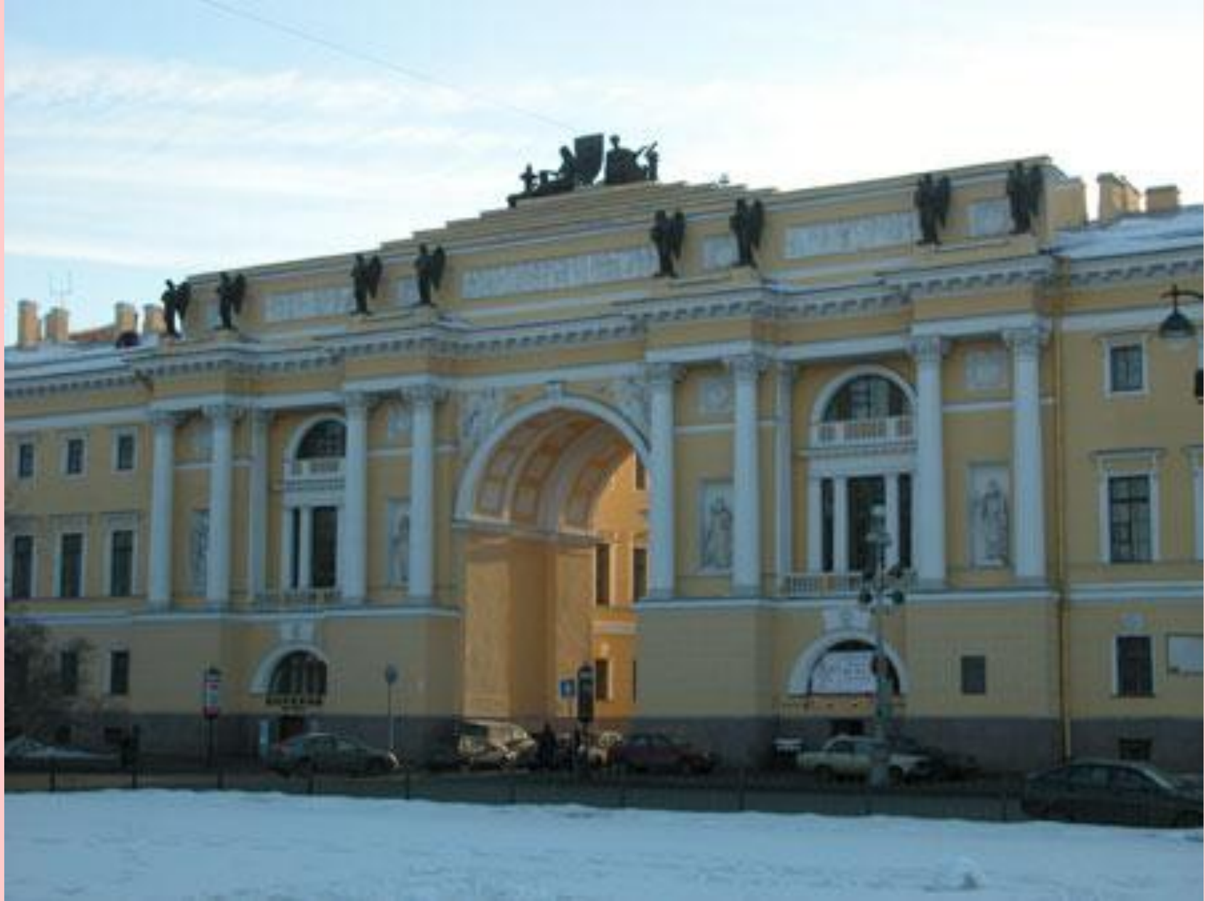
Здание Сената и Синода