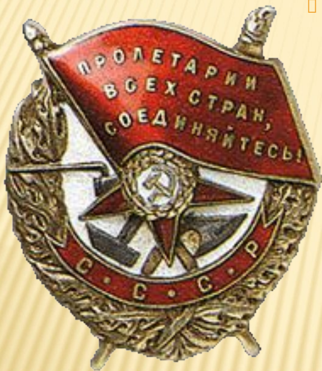
Орден Красное Знамя