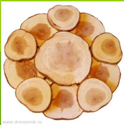
Вариант № 1 № 2