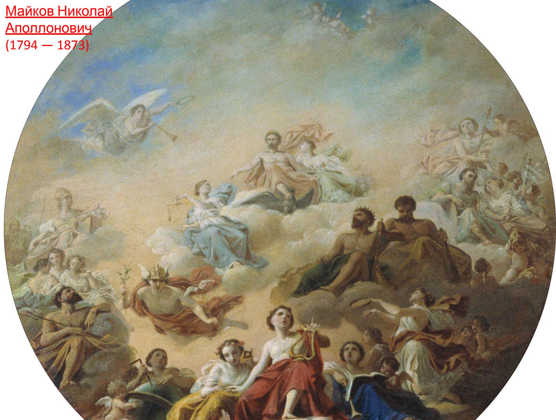
Майков Николай Аполлонович (1794 — 1873)