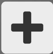
ТАБЛИЦА + И -