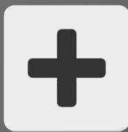
ТАБЛИЦА + И -