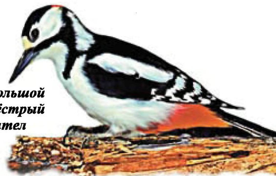
Большой пёстрый дятел