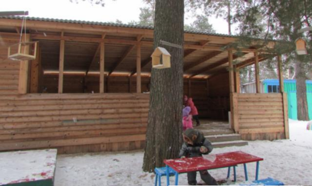
Наша «птичья столовая»