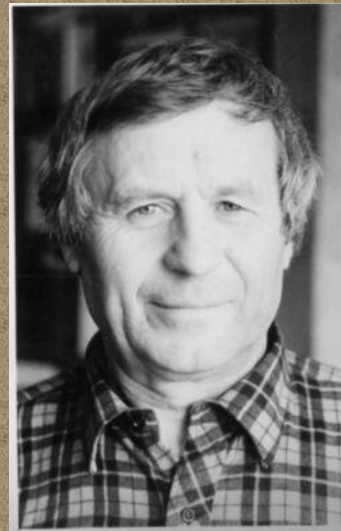
М. Лобанов «Просвещённое мещанство»