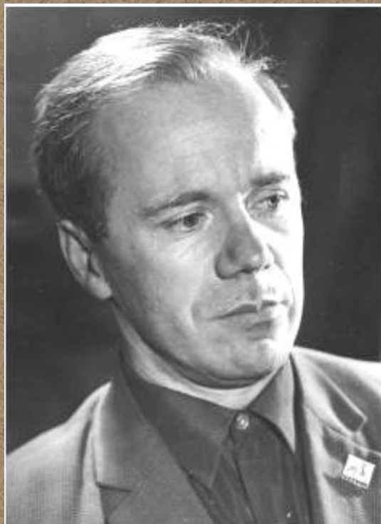
В. Чалмаев «Неизбежность»