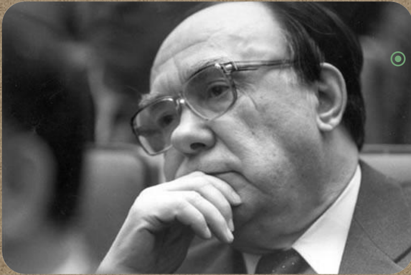
А. Н. Яковлев