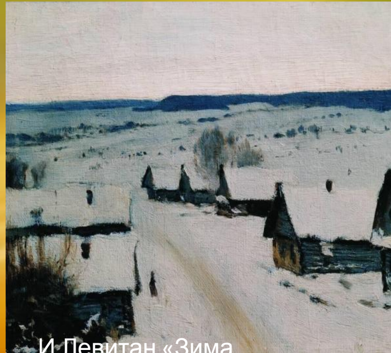
И.Левитан «Зима. Деревенька»