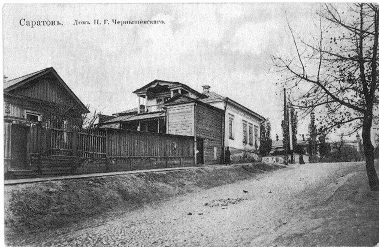
Саратовъ. Домъ П. Г. Чернышевскаго.