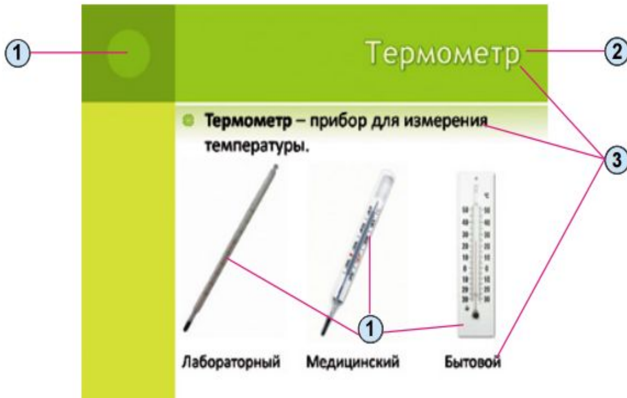
Схема размещения объектов на слайде:

1. Графические объекты 2. Заголовок слайда