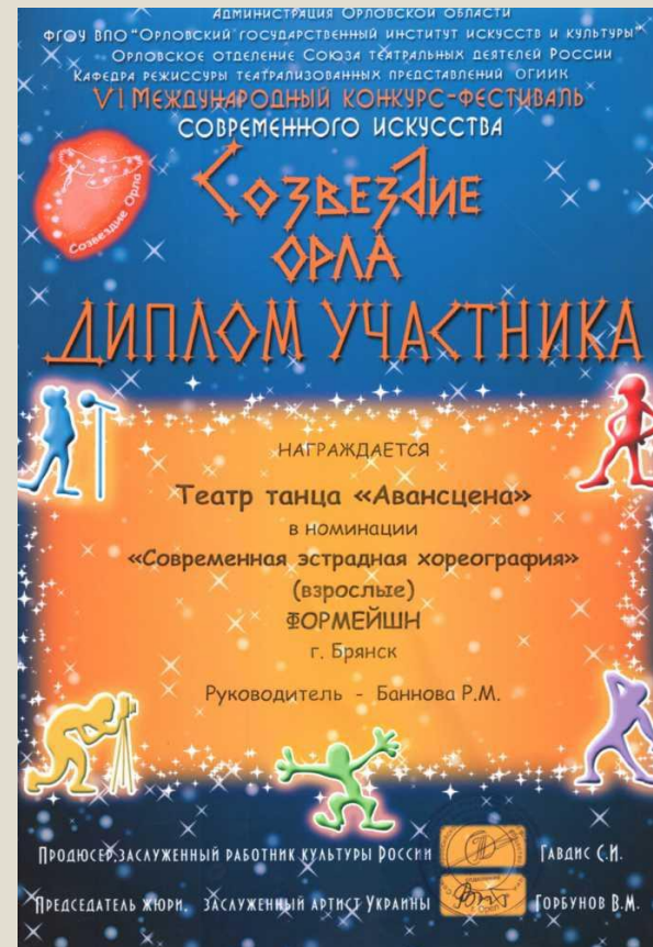
Дипломы с VI Международного конкурса-фестиваля современного искусства «Созвездие Орла»