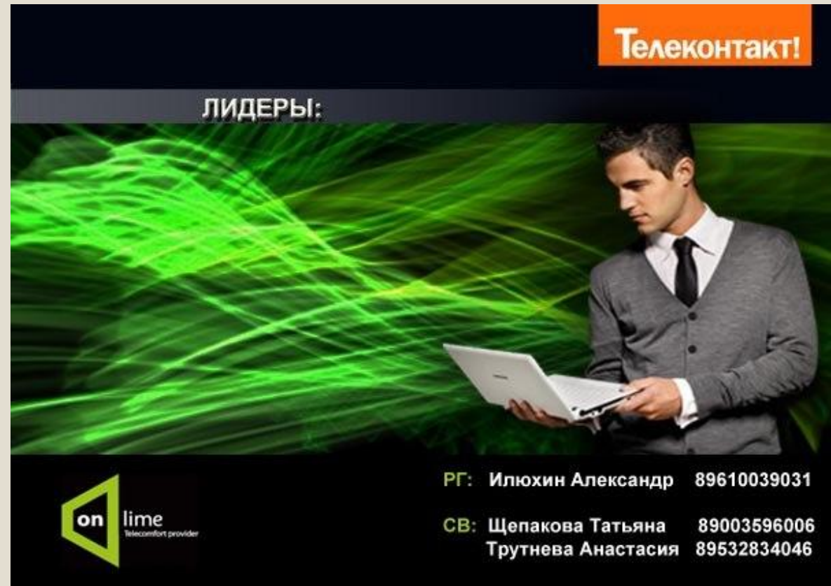
Рекламный стенд для ООО «Телеконтакт»