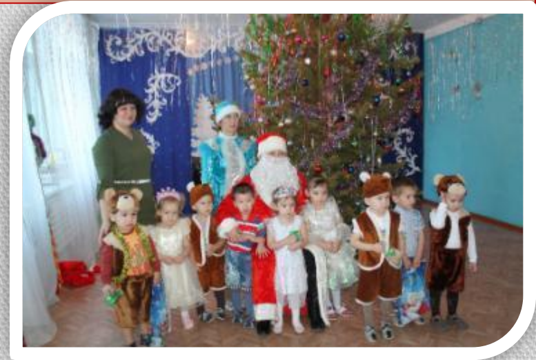
Новый год у ворот.2018