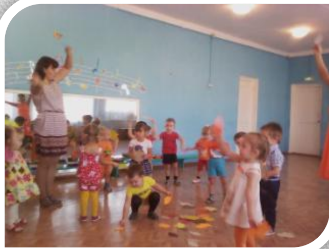
Развлечение «Осеннее настроение».