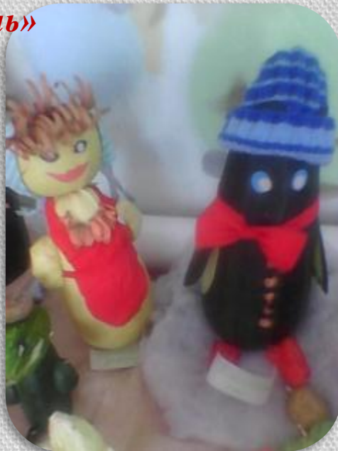
Выставка «Дары осени»