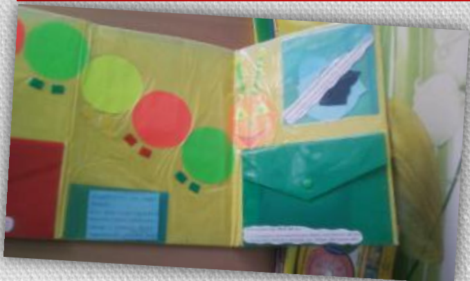
«Форма, цвет, величина»