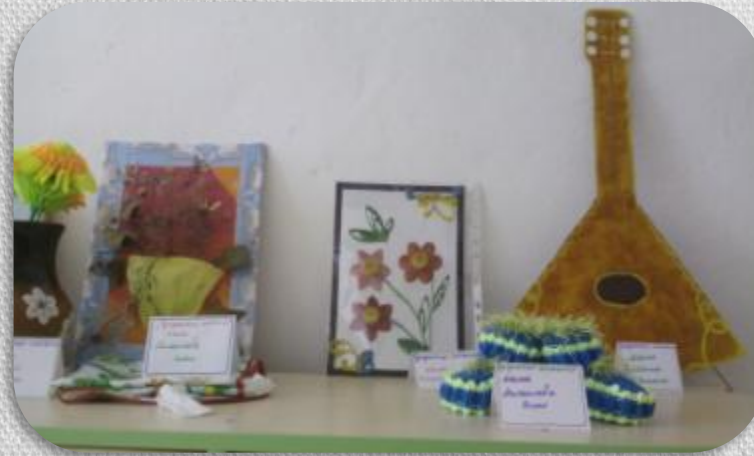
Выставка «Золотые мамины руки»