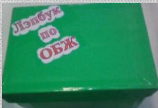
«Берегись бед пока их нет»