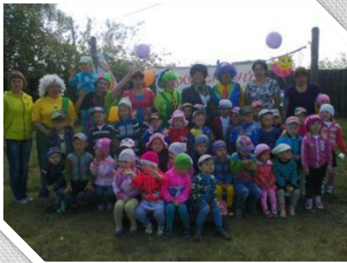
День защиты детей.