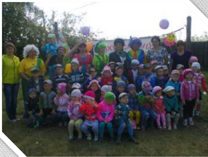
День защиты детей.