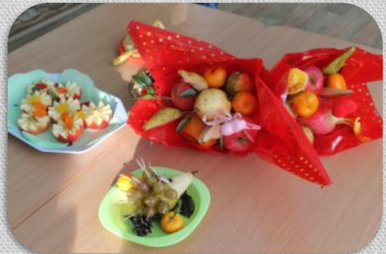
Конкурс «Оформление блюд – Карвинг»