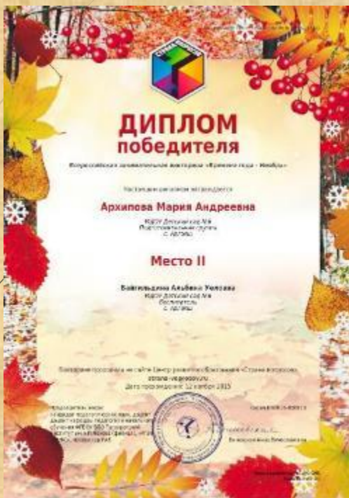
Диплом победителя всероссийской занимательной викторины «Времена года - Ноябрь»