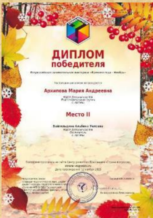
Диплом победителя всероссийской занимательной викторины «Времена года - Ноябрь»