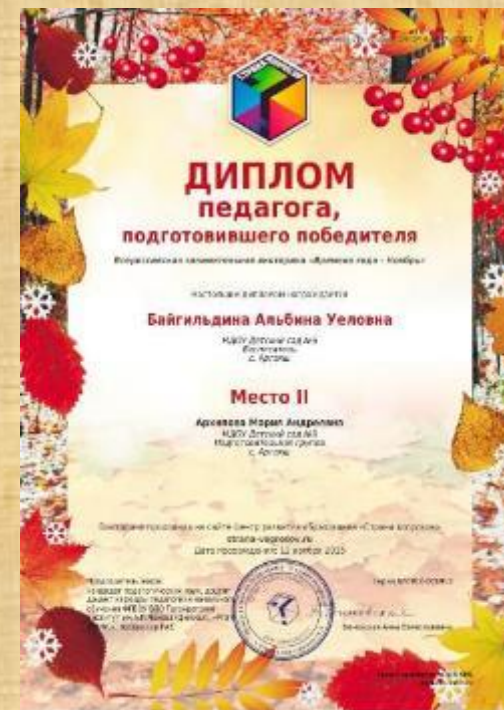
Диплом педагога, подготовившего победителя