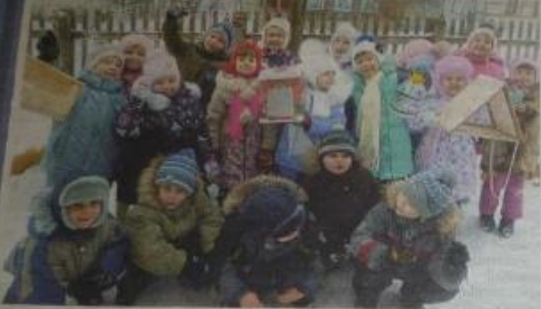
Воспитанники Большеберезниковского детского сада «Теремок» вместе с родителями смастерили более 20 работ, которые разместили на территории дошкольного учреждения.