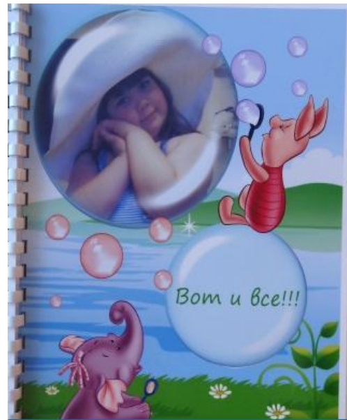
Вот и все!!!