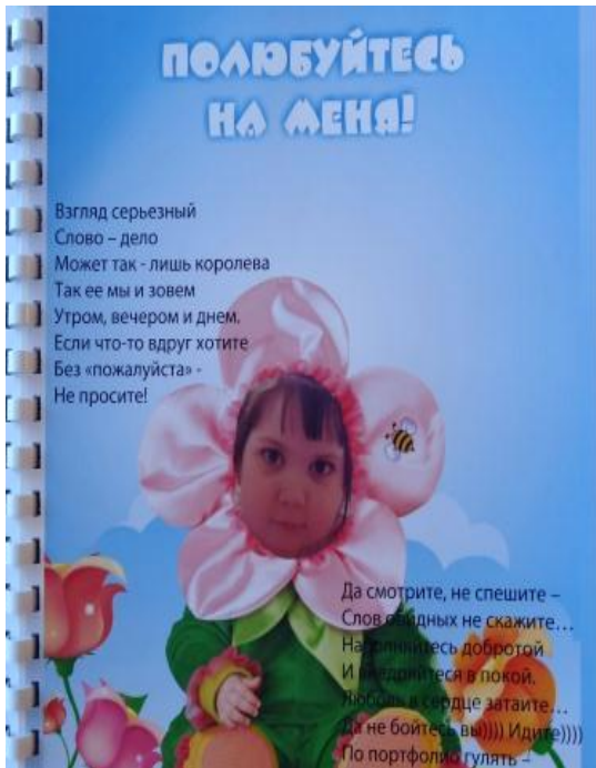
Полюбуйся на меня