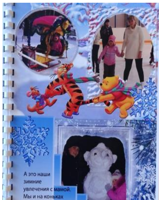
Мои любимые зимние развлечения