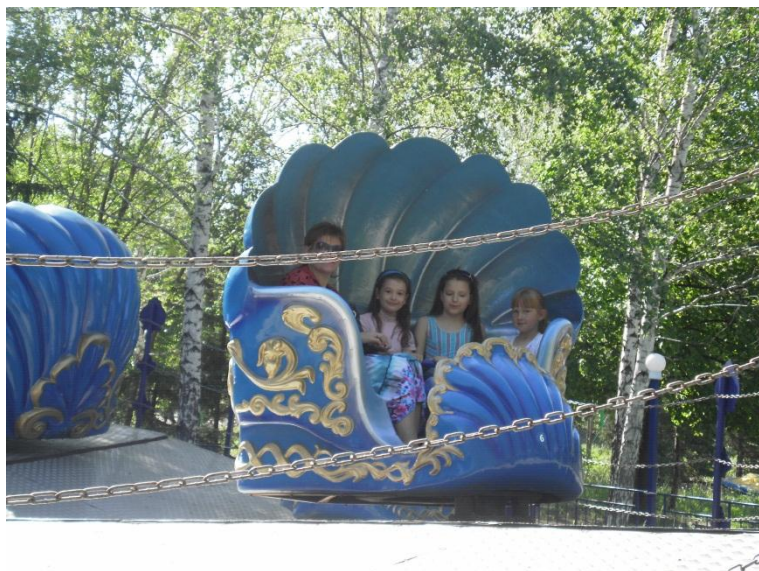
Экскурсия в Лисавенко