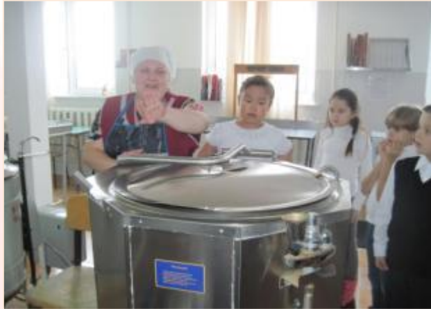
Классный час «Семья и Отечество в моей жизни»