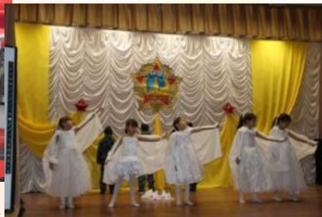
Танец «Журавли». Смотр инсценированной песни