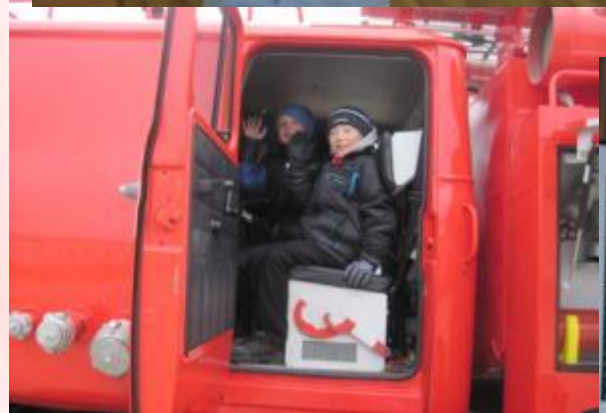
Экскурсия в пожарную часть