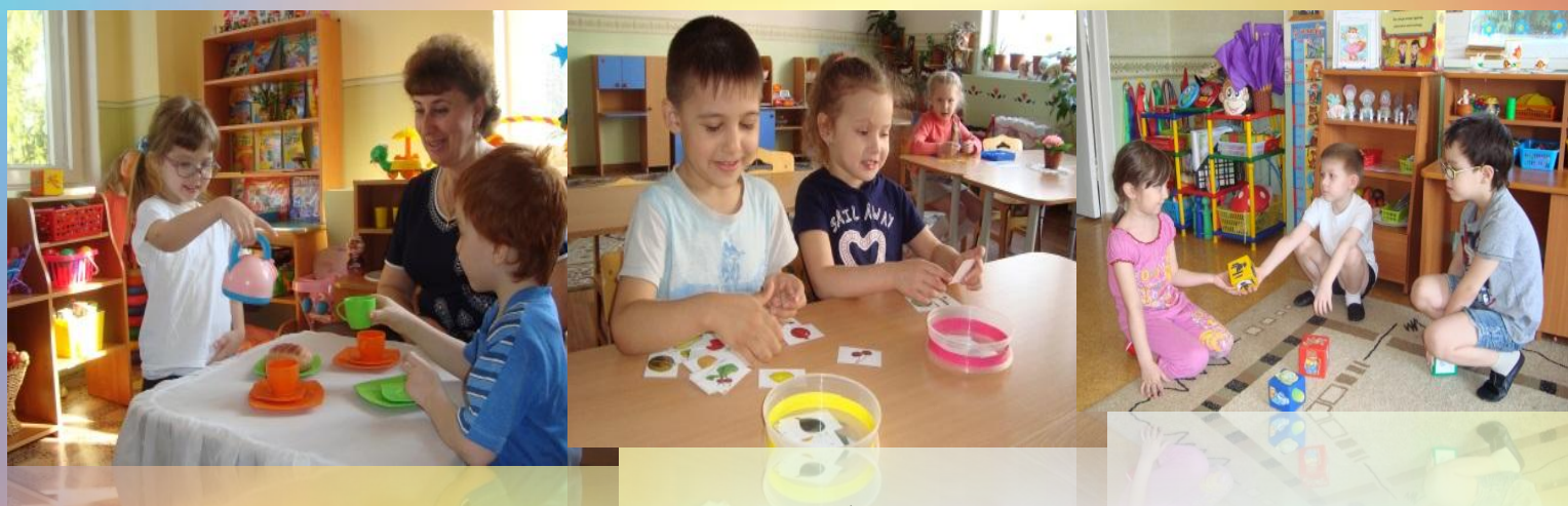
Рис. Применение игровых, проблемных, коммуникативных технологий

Строя взаимодействия в совместно - разделенной действительности и в общении с другими детьми у него развивается коммуникативная речь.