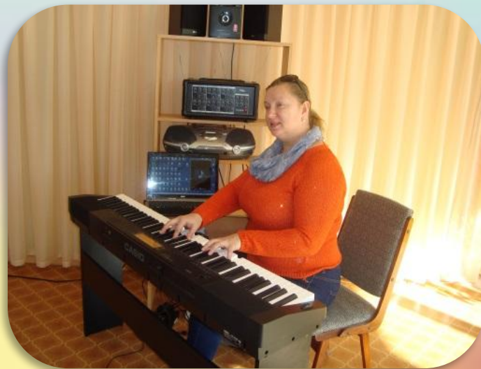
Рис. Применение ИКТ в различных видах деятельности.

Компьютерная технология формирует информационную культуру у детей, делает образовательную деятельность более наглядной и интенсивной, активизирует познавательный интерес, реализовывает личностно-ориентированный и дифференцированный подходы в обучении татарскому и русскому языкам.