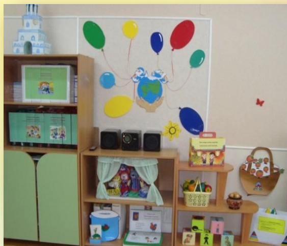
Рис. Развивающая среда