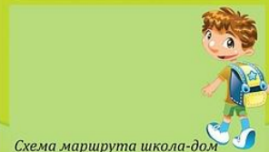
Схема маршрута школа-дом