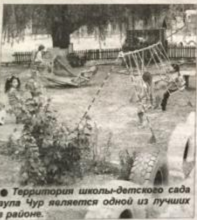
● Территория школы-детского сада аула Чур является одной из лучших в районе.

Пока малышки и девочки наслаждаются заслуженным отдыхом во время летних каникул, школы района проходят проверку готовности к новому учебному году.