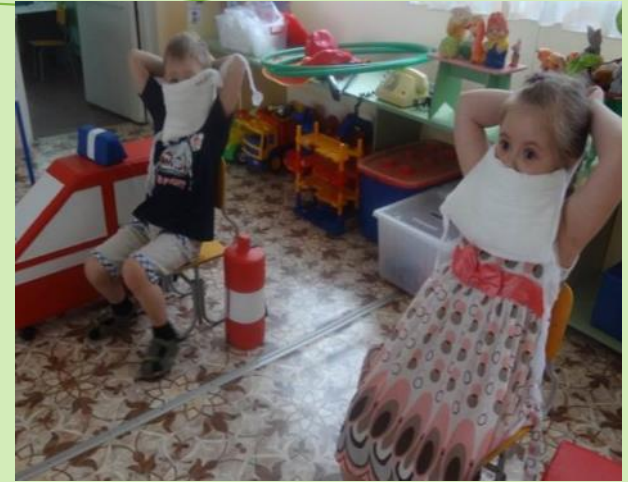
Развлечение «Все работы хороши, выбирай на вкус»