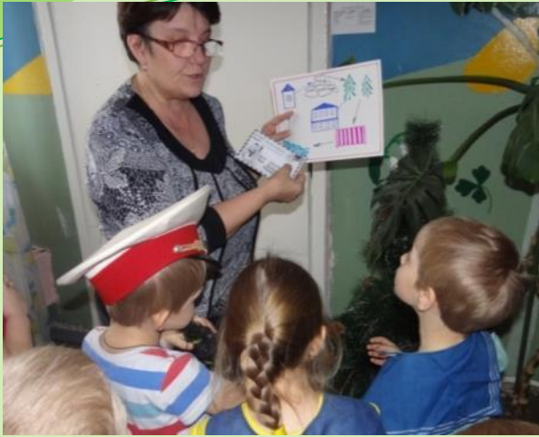
НОД «Помощники Айболита»