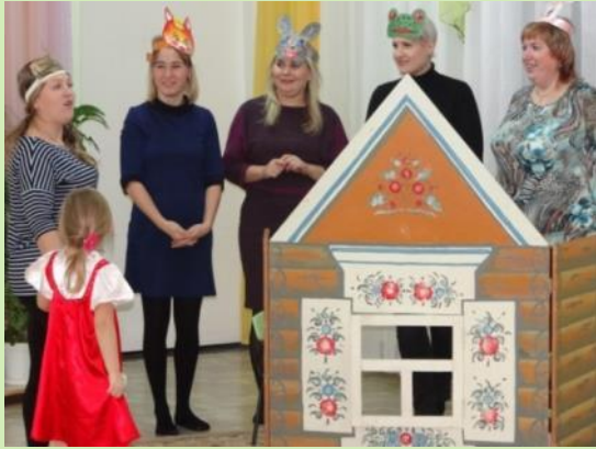
Совместная деятельность детей и родителей. Театрализация русской народной сказки «Теремок»

Внедряю разнообразные формы работы с семьями воспитанников: проведение совместных праздников и выставок, показ открытых занятий, совместное участие в творческих конкурсах, выпуск буклетов. Все это позволяет повысить педагогическую компетентность и активность родителей в вопросах воспитания детей.