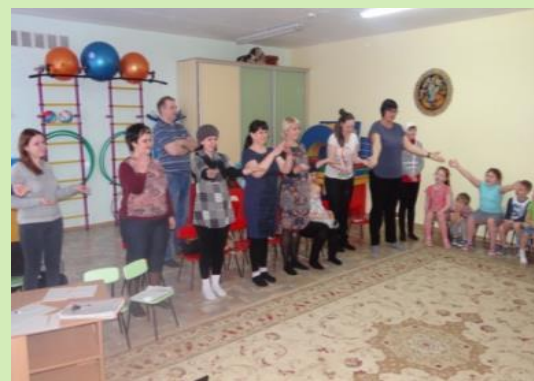
Семинар-практикум «Развиваем речь детей»