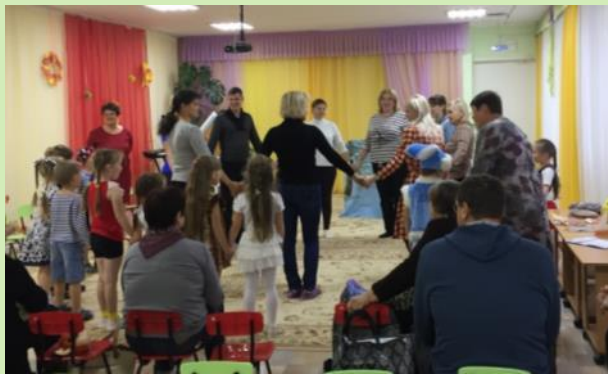
Семейный досуг «В гости сказка к нам идет»