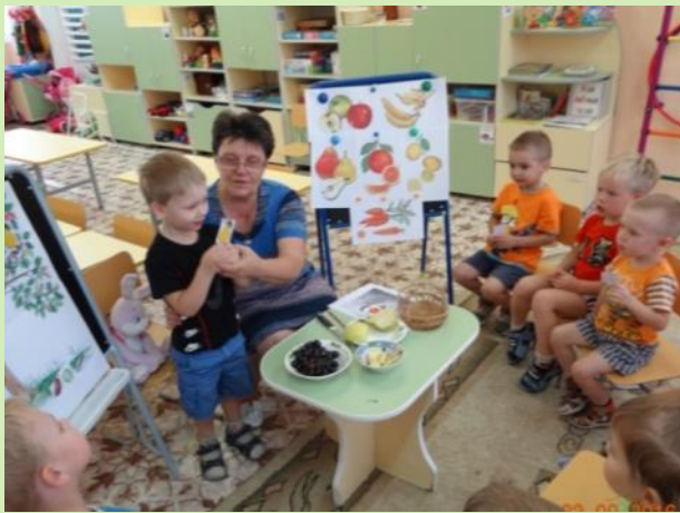
«Готовим фруктовый салат»