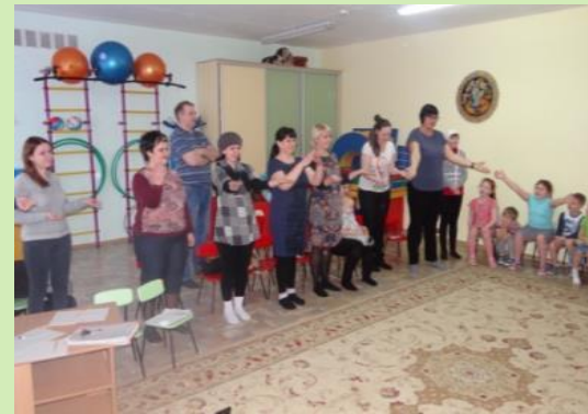
Семинар-практикум «Развиваем речь детей»