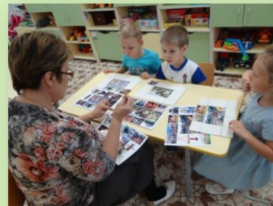
Дидактическая игра «Колесо истории»