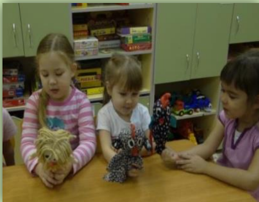
Театр «Бобовое зернышко»

В рамках педагогической инновационной деятельности я постоянно разрабатываю дидактические пособия и игры. Они находят применение во многих областях образовательной деятельности детей и помогают решать большинство воспитательно – образовательных задач.