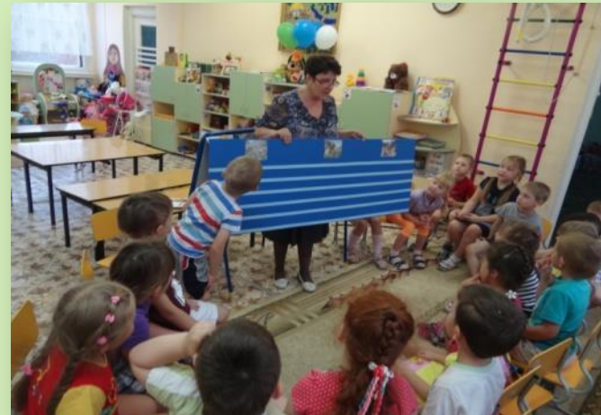
«Путешествие по «реке времени»