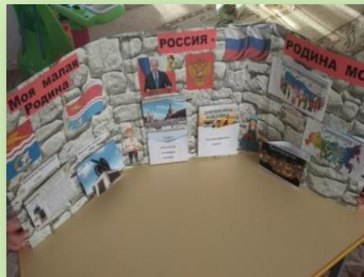
Лэпбук по патриотическому воспитанию