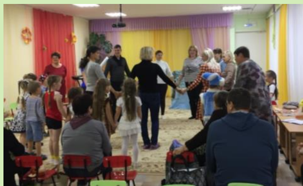
Семейный досуг «В гости сказка к нам идет»