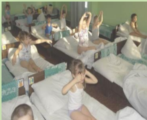
Гимнастика пробуждения после дневного сна

Владею современными образовательными технологиями и методиками, в том числе технологиями развивающего обучения, игровыми, информационно-коммуникационными технологиями, здоровьесберегающими. Применяю их в практической деятельности для моделирования воспитательного - образовательного процесса.