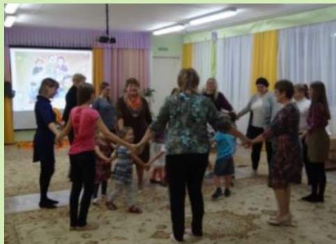
Семейный досуг «Я и моя семья» Игра «Давайте познакомимся»