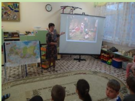
НОД «Путешествие в Крым»