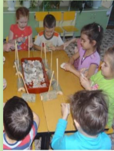
Опыт «Как можно добыть огонь»