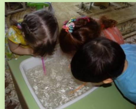
Дыхательная гимнастика «Воздушные пузырьки»