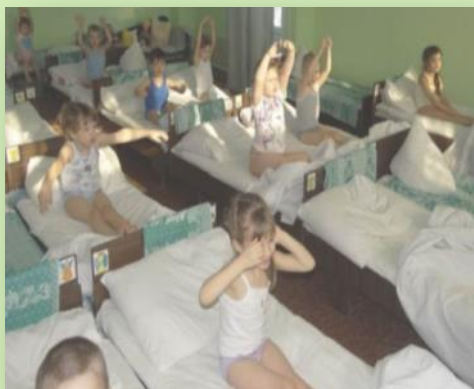
Гимнастика пробуждения после дневного сна

Владею современными образовательными технологиями и методиками, в том числе технологиями развивающего обучения, игровыми, информационно-коммуникационными технологиями, здоровьесберегающими. Применяю их в практической деятельности для моделирования воспитательного - образовательного процесса.