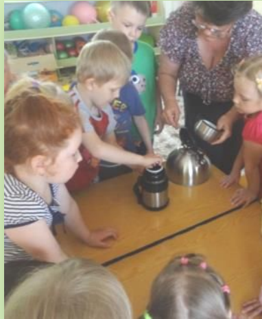
Опыт «Сохраним воду горячей»