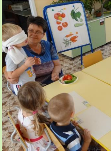
НОД лепка «Угощение для зайчика»