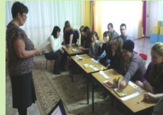
Круглый стол «Слова любви к своему ребенку»