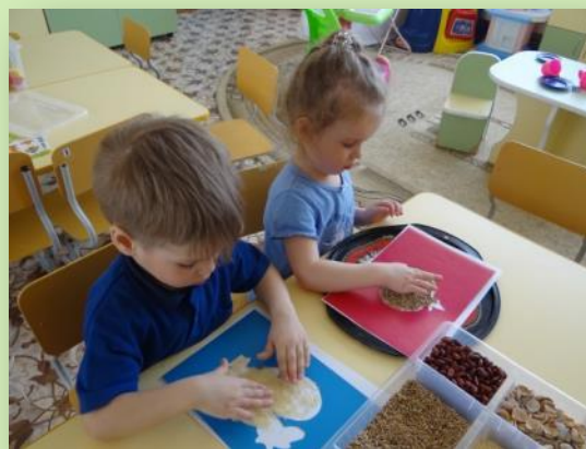
Игра «Выложи картинку»