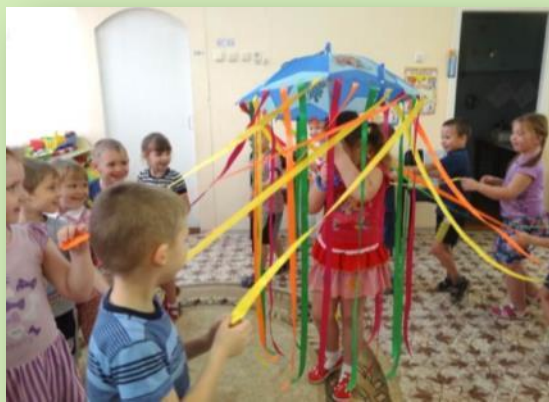
Пособие «Веселый зонтик»