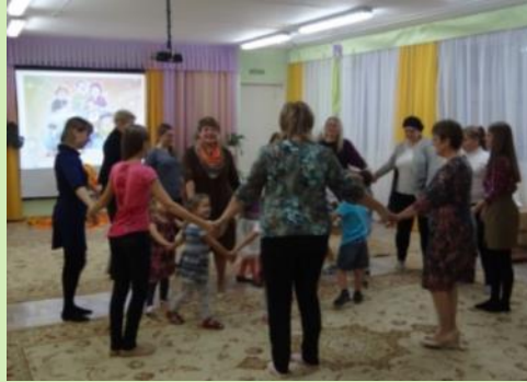
Семейный досуг «Я и моя семья» Игра «Давайте познакомимся»