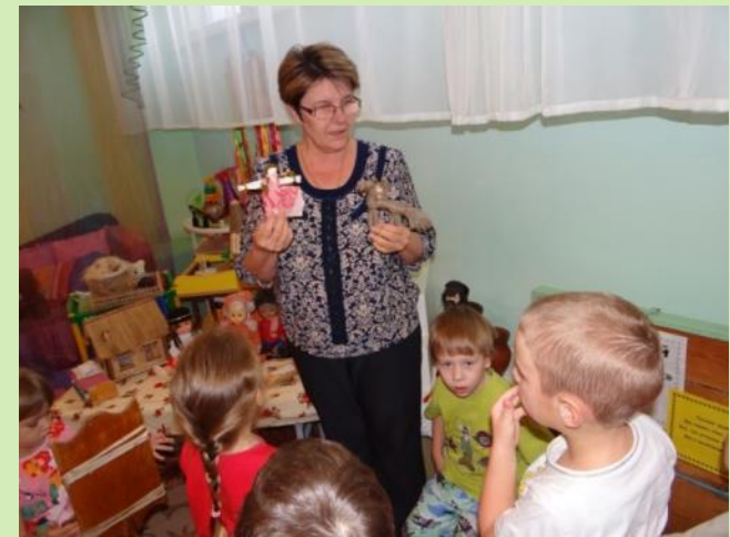
Беседа «Игрушки наших бабушек»