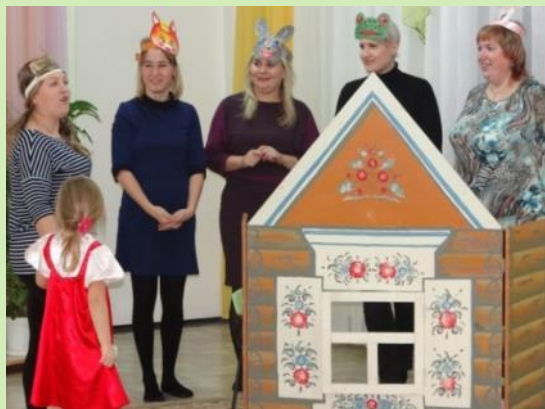
Совместная деятельность детей и родителей. Театрализация русской народной сказки «Теремок»

Внедряю разнообразные формы работы с семьями воспитанников: проведение совместных праздников и выставок, показ открытых занятий, совместное участие в творческих конкурсах, выпуск буклетов. Все это позволяет повысить педагогическую компетентность и активность родителей в вопросах воспитания детей.