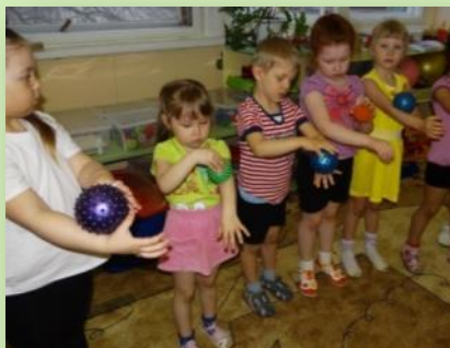
Оздоровительная технология «Су-Джок»