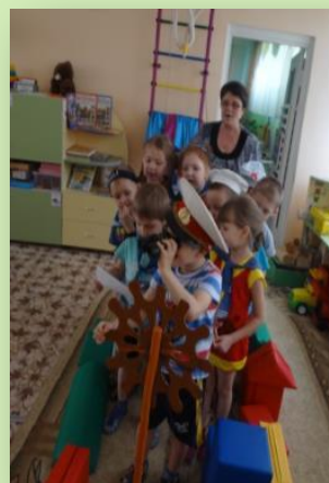
Сюжетно-ролевая игра «По морям, по волнам...»