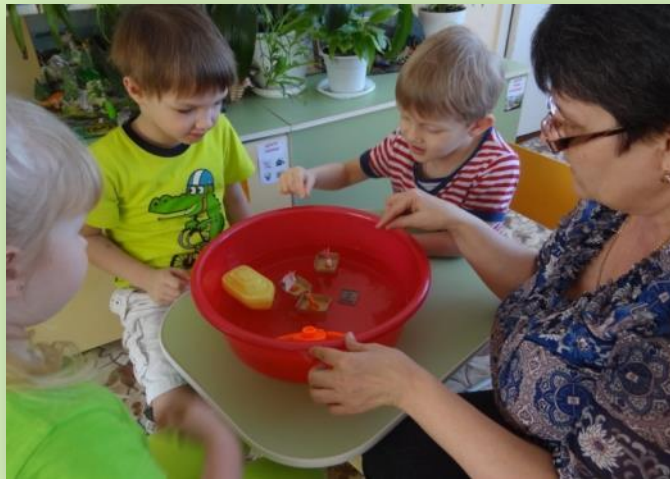
Опыт «Тонет, не тонет...»