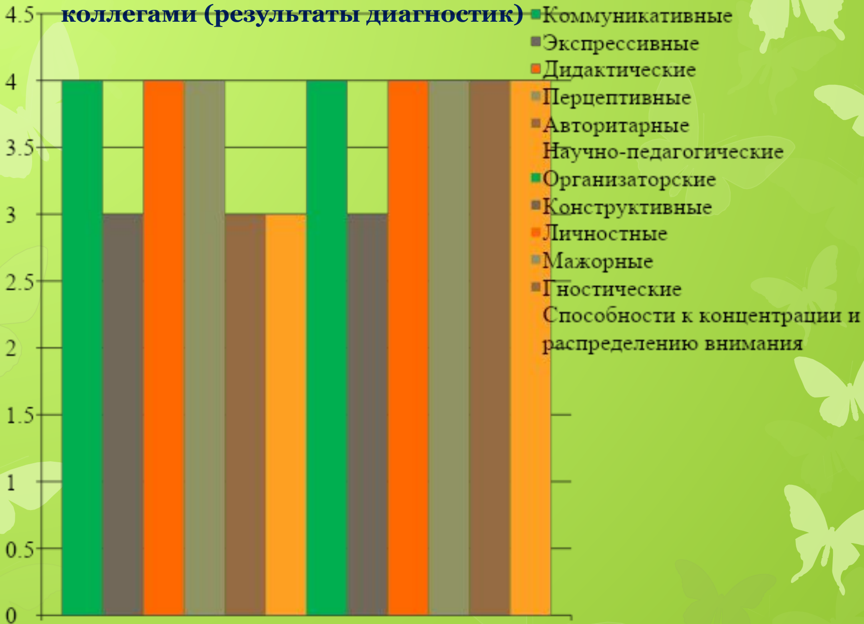
Анкета "Способности педагога"