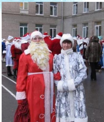
Роль Деда Мороза