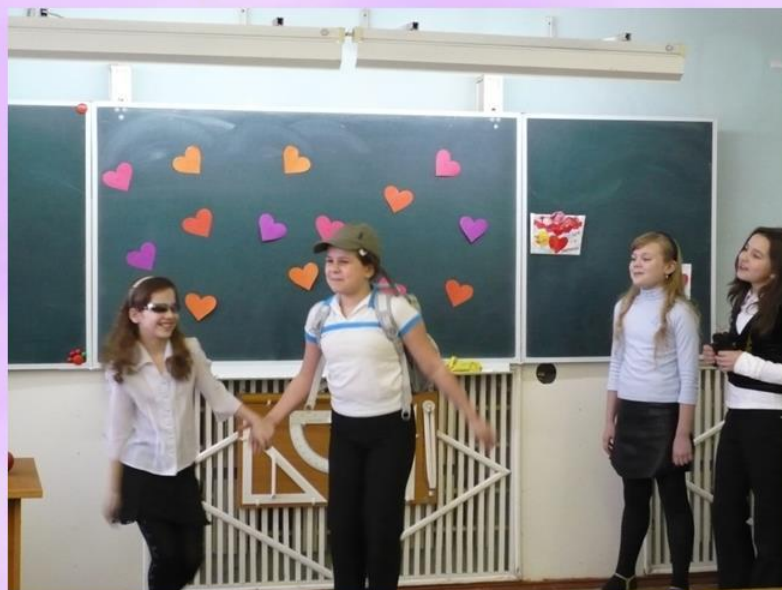
День Святого Валентина