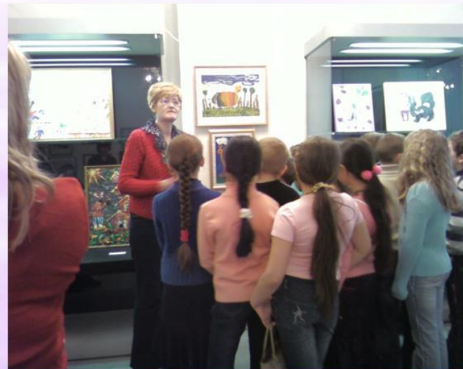
Музей им. Сурикова