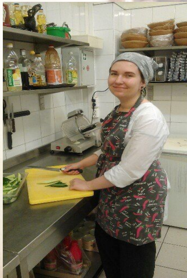
Гостиница «Октябрьская» ресторан «Ассамблея»