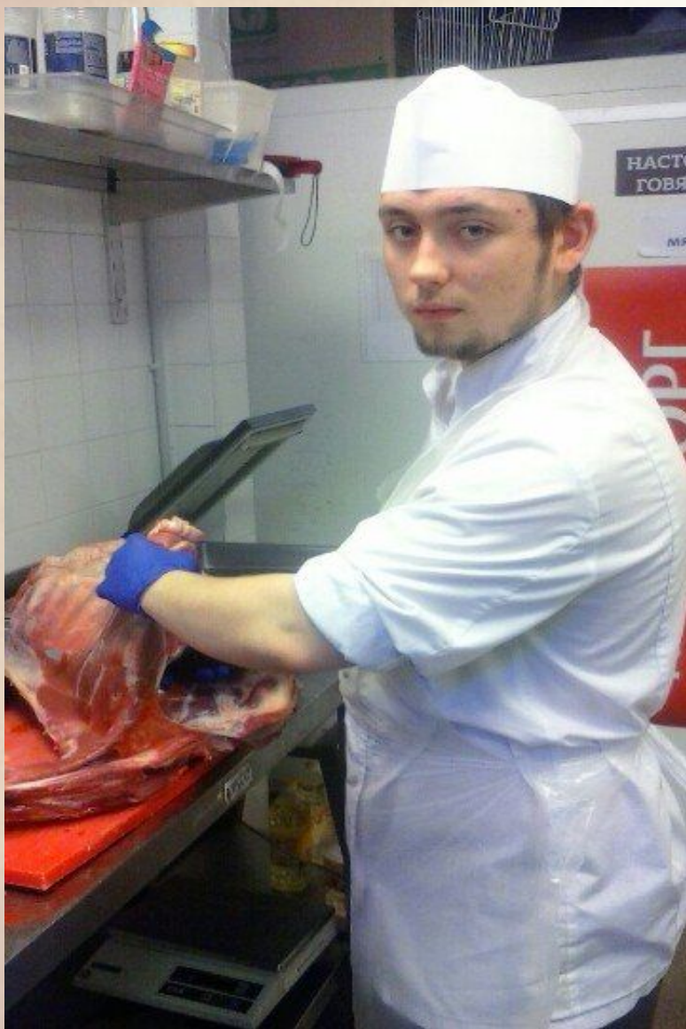
"Sokos "Palace Bridge""