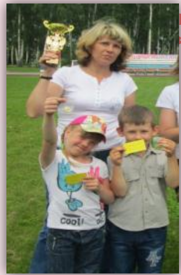
I место общекомандном зачёте (по итогам зимних и летних соревнований) и золотые значки ГТЗО