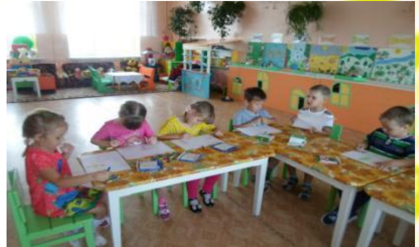
Конструктивно- модельная деятельность