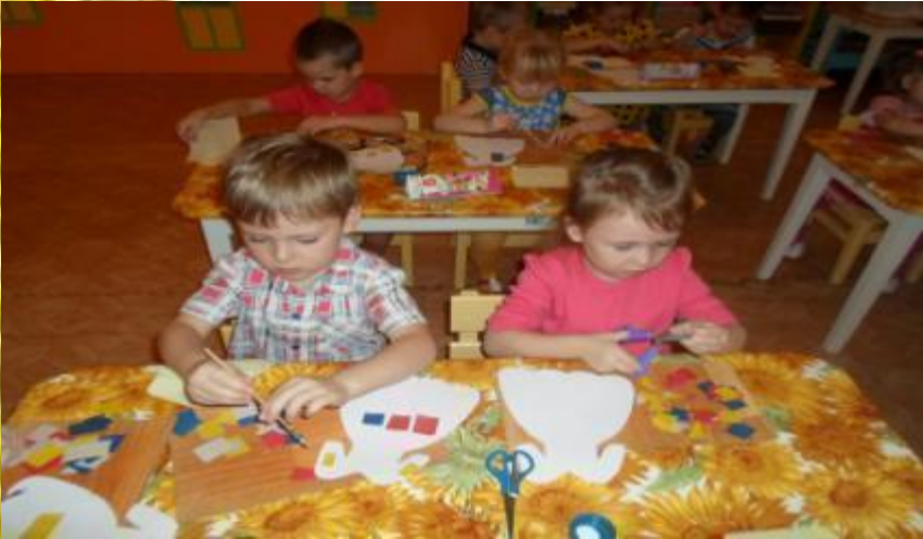
Приобщение к искусству