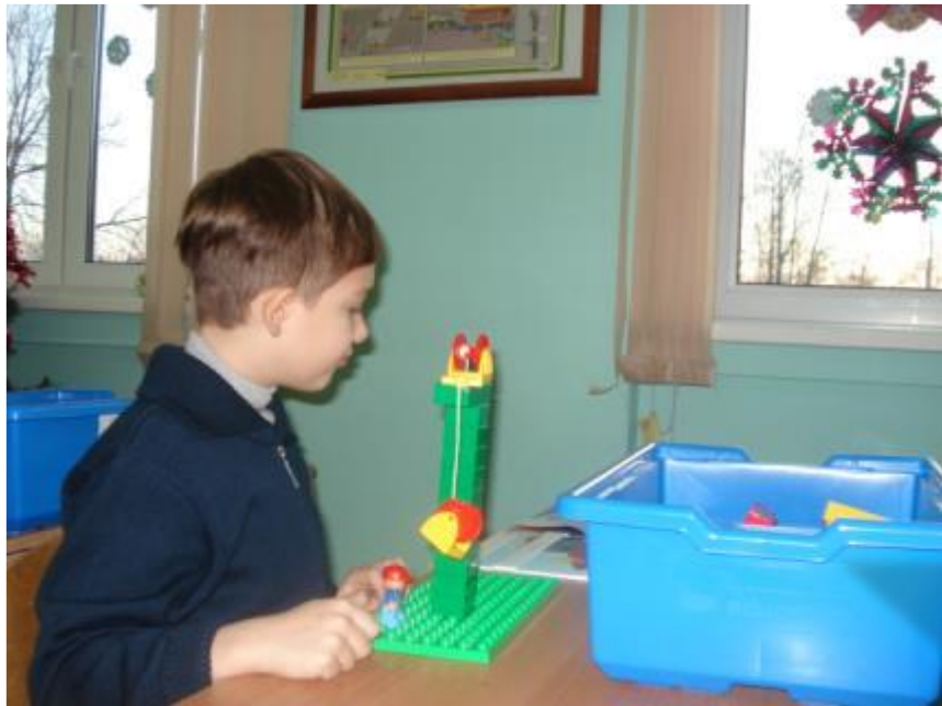
Проект «Создание и исследование игрушки-балансира и игрушки-вертушки»