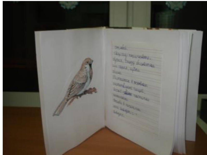
Проект «Зимующие птицы школьного двора»