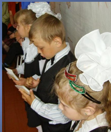
Читаем стихи на линейке