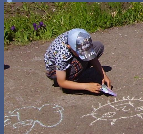
1 июня – конкурс рисунка на асфальте