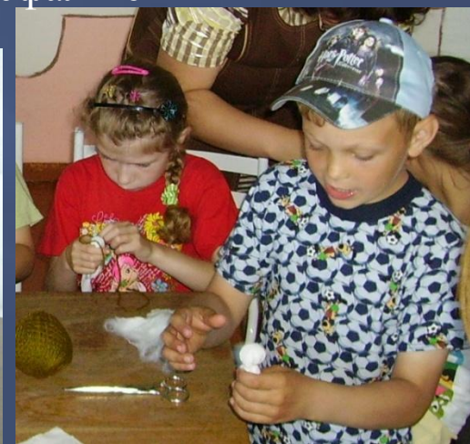
Мастерим кукол своими руками