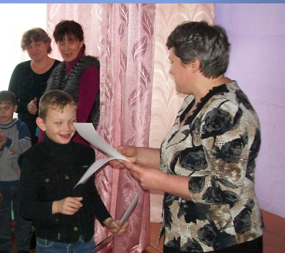
Грамоты за хорошую учебу и участие в районном конкурсе