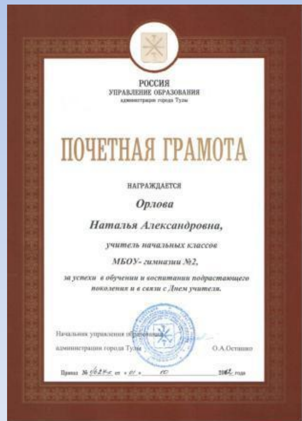
Почётная грамота Управления образования Администрации г. Тулы 2012 год