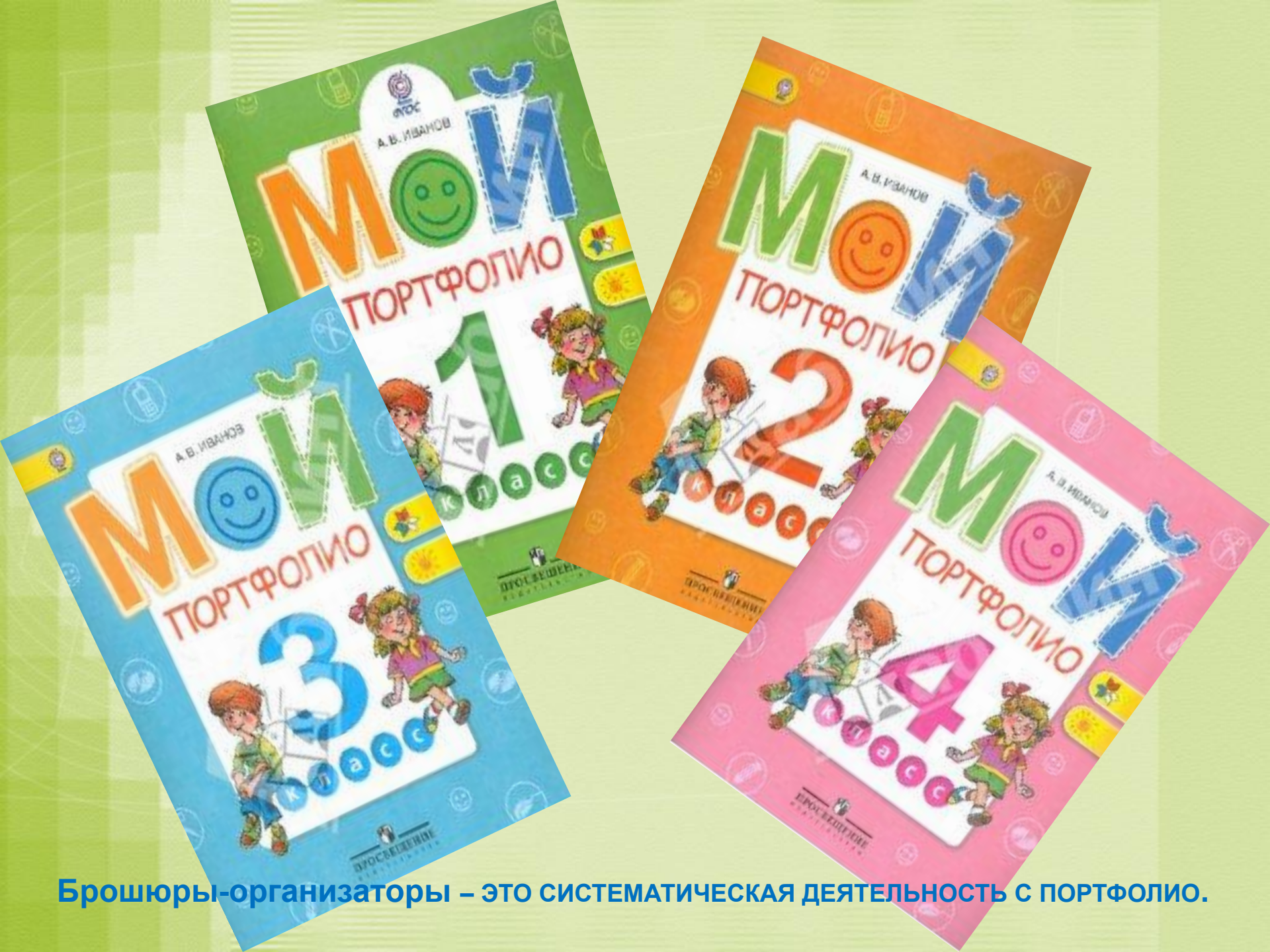
Брошюры-организаторы – это систематическая деятельность с портфолио.